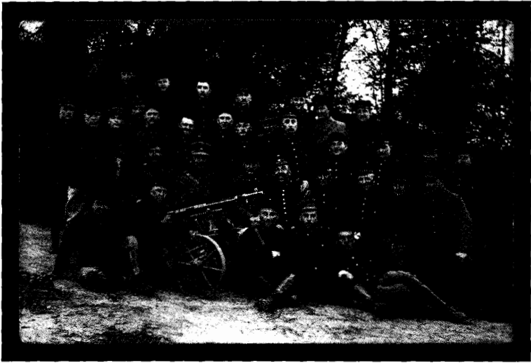
Afb. 1 Groepsfoto van de soldaten in Criel-sur-Mer; Berten Pil op de eerste rij zittend, de eerste van links.

soms tot een treffen tussen beide legergroepen. 21 Van voorbijtrekkende stromen vluchtelingen die van over Roeselare, Moorslede en Passendale aankwamen, hoorden de dorpingen verschillende sterke verhalen over het Duitse geweld. Uiteindelijk besloot de familie Pil te vluchten, samen met de andere inwoners van Zonnebeke, op 20 oktober. Na een tiendaags verblijf in Ieper trok de familie verder naar Reningelst, waar ze tot 14 mei 1915 bleef om daarna door te reizen naar Parc-Saint-Maur in Frankrijk, omdat het leven in België onuitstaanbaar werd. Intussen had Berten zijn wens om soldaat te worden vuriger dan ooit uitgedrukt. Vader en moeder Pil konden hun zoon niet meer ompraten en hij meldde zich als vrijwilliger aan bij het Belgisch leger in Calais. 22