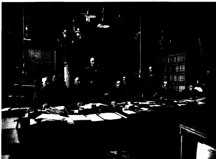
Het personeel van het Kortrijkse Passbüro , z.d. (Openbare Bibliotheek Kortrijk – Bewaarbibliotheek, Kl. Icon. 101/242.02)