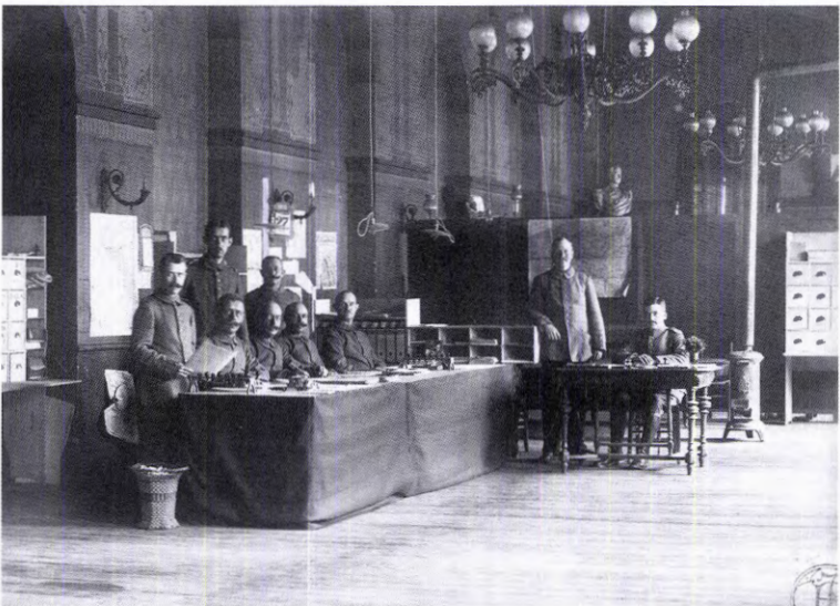
Het personeel van het Kortrijkse Meldeamt , z.d. (Openbare Bibliotheek Kortrijk – Bewaarbibliotheek, Kl. Icon. 101/253.01)