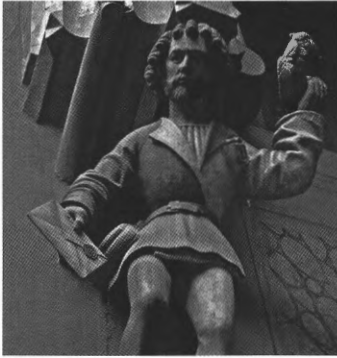
De stadsbode op de gevel van het stadhuis van Basel

beelding 2) 7 . Zijn aanwezigheid wordt gezien als een allusie op de annunciatie op het centrale paneel.