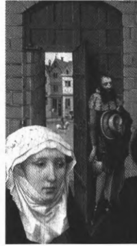
Afbeelding van de Mechelse stadsbode (detail van het rechterpaneel van het Merode-triptiek)

Dit artikel wil bijdragen tot een betere kennis van de stadsboden in het algemeen en de Brugse stadsboden in het bijzonder. Deze functie werd reeds kort behandeld in de studies over de stedelijke officiën van André Vandewalle 8 . Maar verder onderzoek hierover was zeker nog nodig. Ik wil in dit artikel verder ingaan op de rekrutering van messagiers. Ik onderzoek wie precies deze functie op zich nam en hoe lang hij in dienst bleef. Vervolgens wordt de precieze verloning en de taakinhoud besproken. Valt de messagier binnen de stedelijke administratie in de lagere loonklasse, of kon hij toch rekenen op een goede verloning? Tot slot ga ik in op de functie van de stadsbode binnen Brugge zelf en eventueel andere taken die de bode op zich nam.