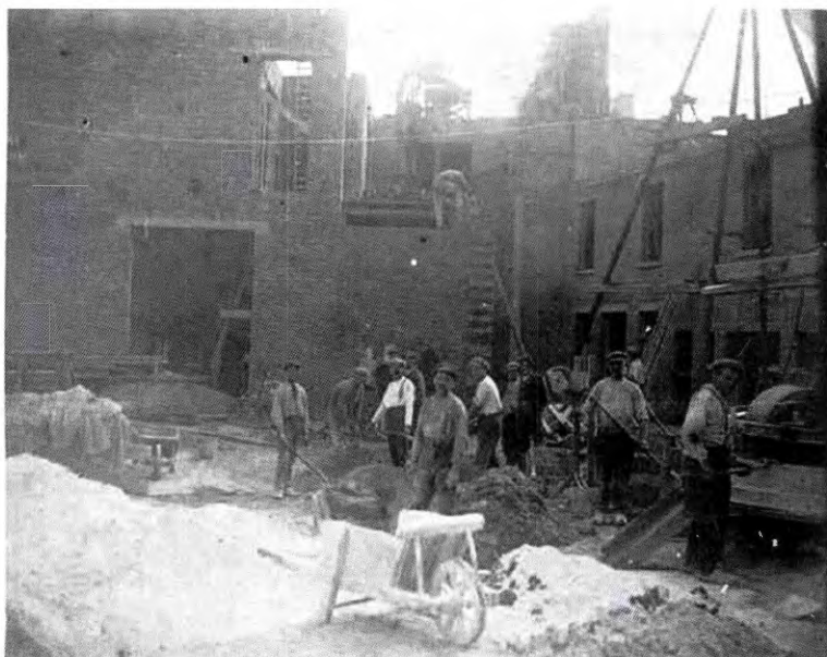
De bouw van het volkshuis en Feestpaleis in Meneen, 1922-1924.

grensarbeiders hogere lonen dan in België uitbetaald, maar vanaf eind 1945 bracht de monetaire politiek van Frankrijk hen steeds meer in moeilijkheden. Herhaalde muntdevaluaties knaagden telkens een stuk van hun loon af en slechts met behulp van bonificaties en toelagen kon hun inkomen op peil gehouden worden. 22 Deze laatste problematiek was aanleiding voor vijf algemene stakingen in vier jaar tijd, waarvan de laatste tien weken aanhield. Aan het begin van de jaren '50 keerde de rust min of meer terug. 23