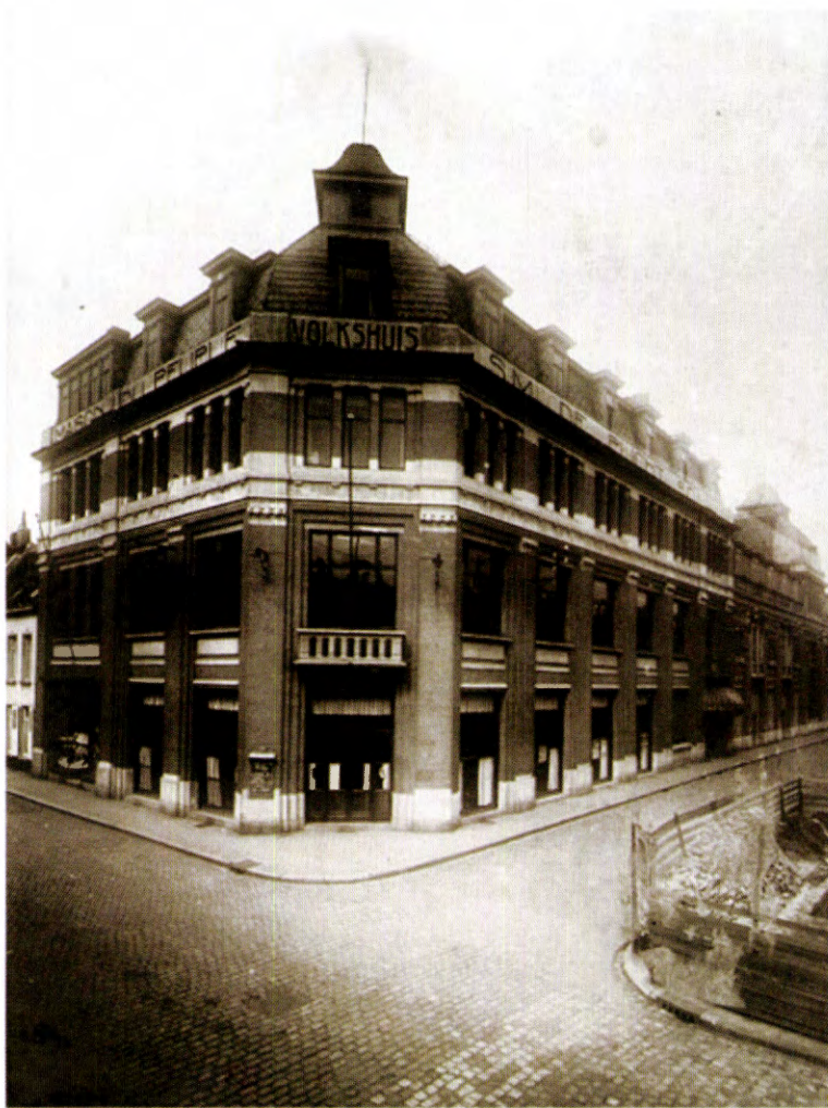
Het volkshuis en Feestpaleis in Meneen, z.d..