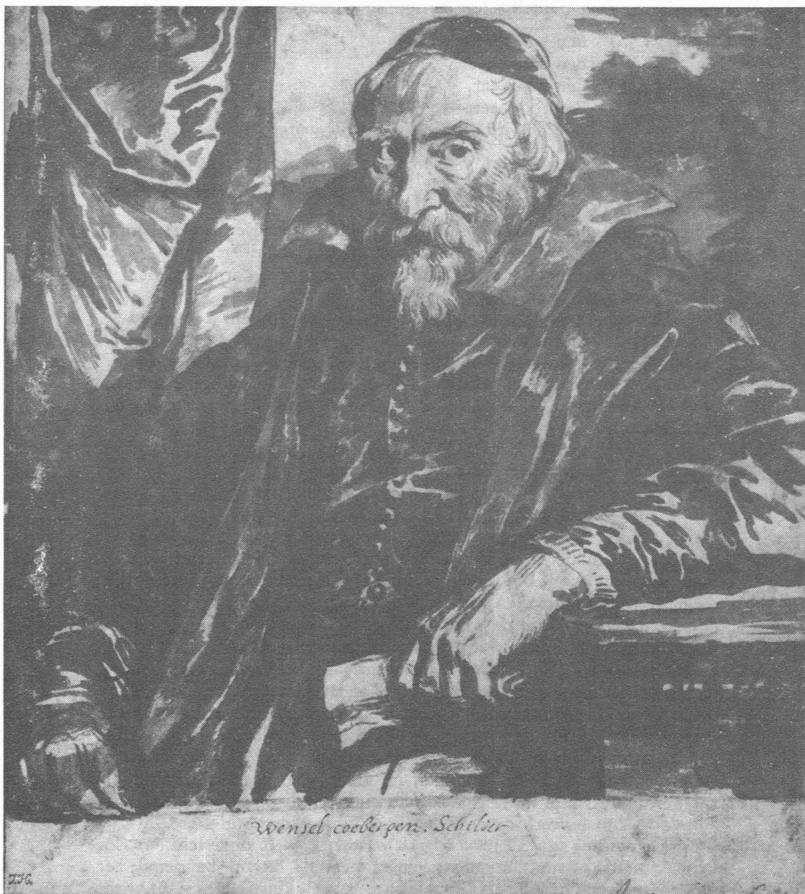
Portret van Wensel Cobergher door van Dyck. (Papier, potlood en bister, 22,3 x 19,8 cm). Amsterdam, Stedelijk Museum.