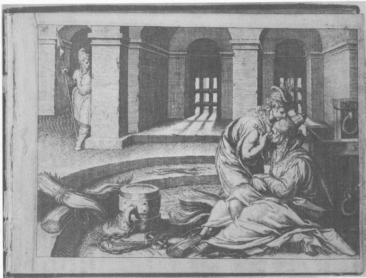
Simon-en-Pira. In klassieke trant uitgevoerde kopergravure, die mag toegeschreven worden aan de Gentenaar Judocus Hondius (= Dhondt) 1606.