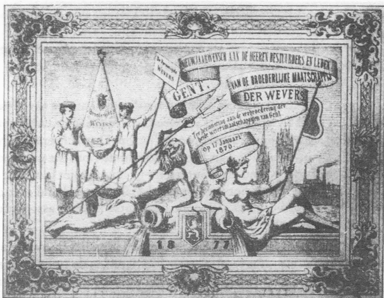
Nieuwjaarsgroet der hereenigde Weversmaatschappijen voor 1877