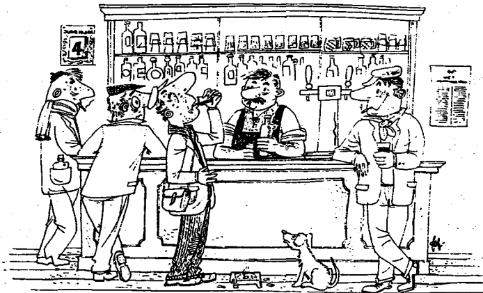
Een “druppel van de vuile flassche”

Onze werkersbevolking, die slechts bij “Meneere” (lees de dokter) ging in geval van uiterste nood en ook nog niet gewoon was (of niet kapitaalkrachtig genoeg) om voor een kleinigheid bij de apotheker binnen te wippen en beroep te doen op zijn duizend en één specialiteiten, zorgden gewoonlijk zelf voor hun gezondheid. Bij het “opkomen” en het “afval-