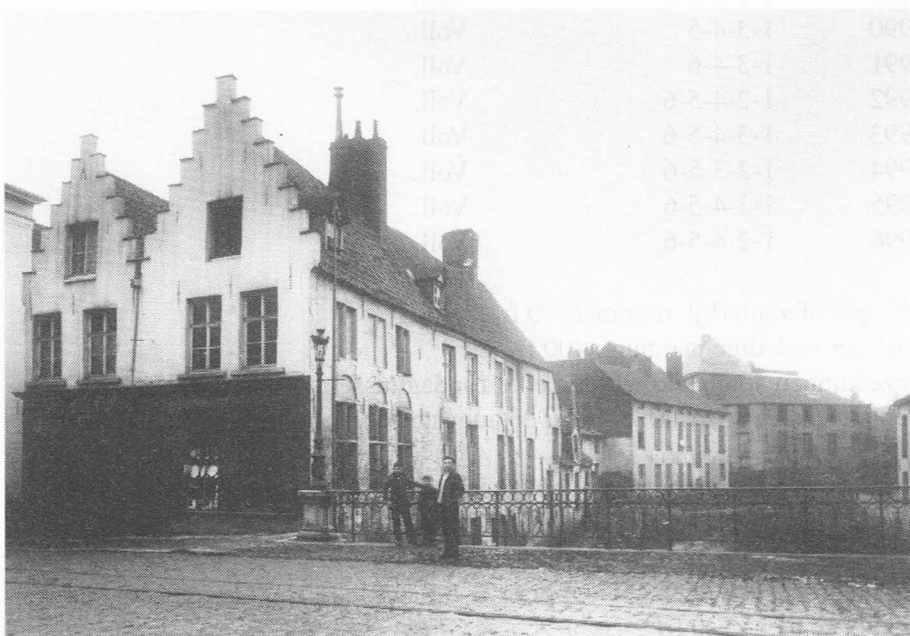
De Houtleie met de Turrebrug in 1900.