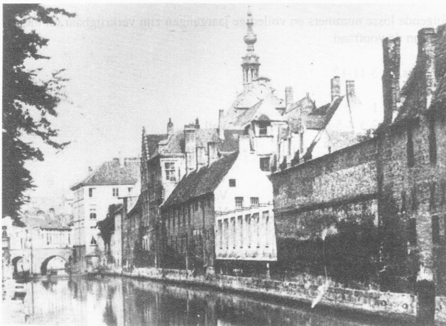
De Houtleie met het Alexianenklooster rond 1870.