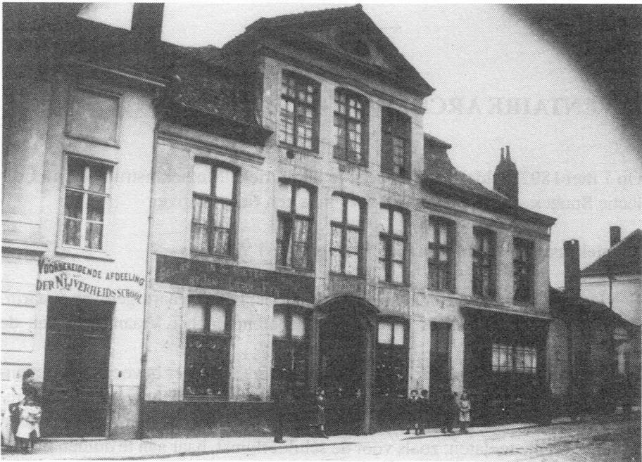
Stadsschool Spanoghe, St.-Lievenspoortstraat 6.

Ik draag altijd veel zorg voor boeken. Ik vind het verschrikkelijk en het doet