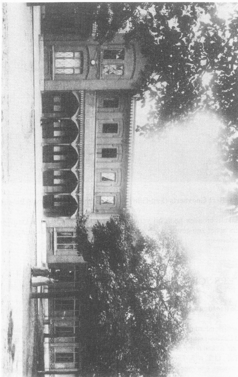
De "huizen" van de Schieting" op de Martelaarslaan.