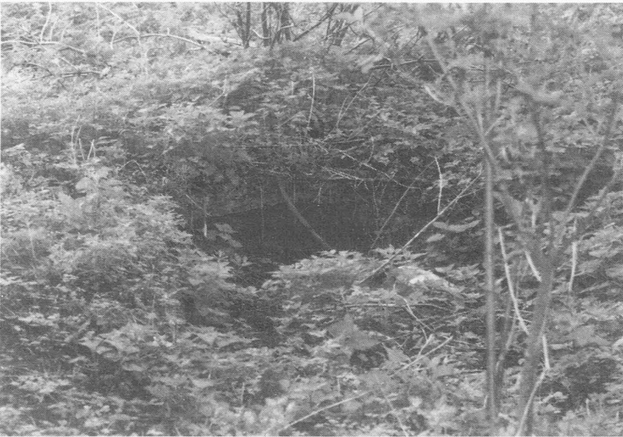
15. Schipdonkvaart-zuid, 26/04/99. 200 m ten westen van 'Fort Raepschot' vond mijn zoon Patrick de resten van deze loopgraaf.

Rond 9 uur conferentie bij [compagniescommandant], met [verbindingsofficieren]. De kanaaldijk moest andermaal verkend en zoo mogelijk alle loopgrachten vóór onzen sector bruikbaar gemaakt. Met zes man vertrek ik tegen 10 uur. Ongehinderd wordt het kanaal bereikt. Thans blijkt het onbetwistbaar dat de vijand zich in den dag niet meer regelmatig over het kanaal waagt. Ik stel mijn mannen in dekking op en onderzoek persoonlijk, meter voor meter de loopgrachten [foto 15]. Eén net van mijnen en [boobytraps] is verspreid door al de loopgrachten. Alles wordt ontladen en gewoon op zijn plaats gelaten.