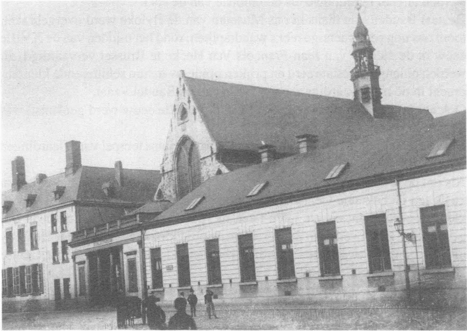
De Baudelookapel. Ingang langs de Ottogracht. Universiteitsbibliotheek tot in 1942. Later Stadsbibliotheek tot in 1980.

Van gans dit complex met zijn smalle straatjes, zijn riviertje en vier kleine bruggen, van die eens zo stemmige en ruime abdij, is niets overgebleven dan de kapel en het torentje die verstoppertje spelen tussen een groep gebouwen en de bomen van het Baudelo-tuintje.