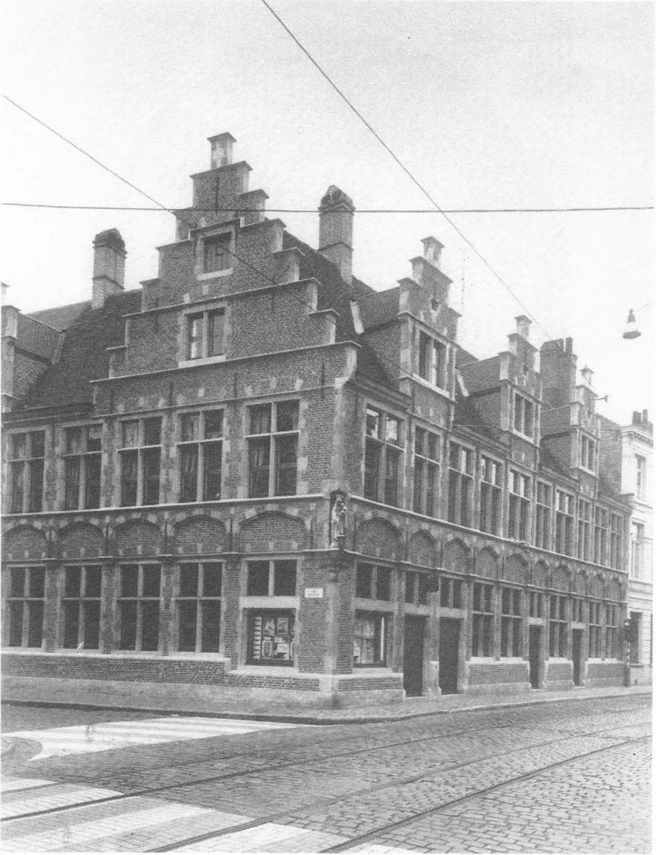
Het "Gemeentekrediet" op de hoek van de Hoog- en Holstraat.

spreuk ingekapt werd, zoals "Wetenschap verlicht", "Kunst adelt", "Wie niet meer uitgeeft dan hij wint is rijk", "Rust maekt roest", "Een wijze vrouw is beter dan een schone vrouw", enz, enz. Wie wandelt langs de huizen van Semeij en zijn ogen opendoet krijgt een les van Zedenleer.