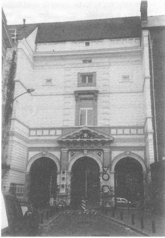
"De drie goaten" in de Tweebruggenstraat.