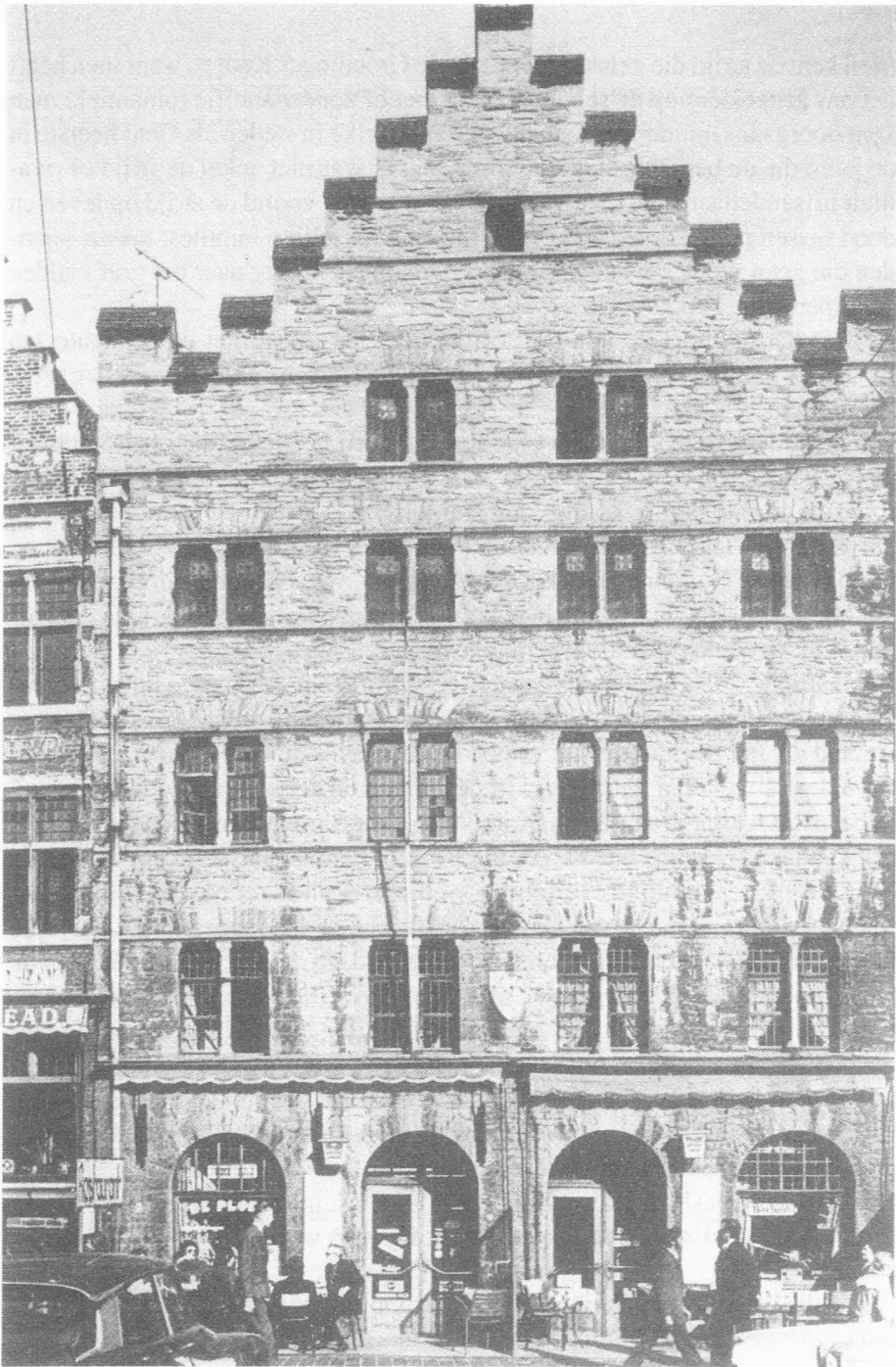
Het Borluutsteen op de Korenmarkt.