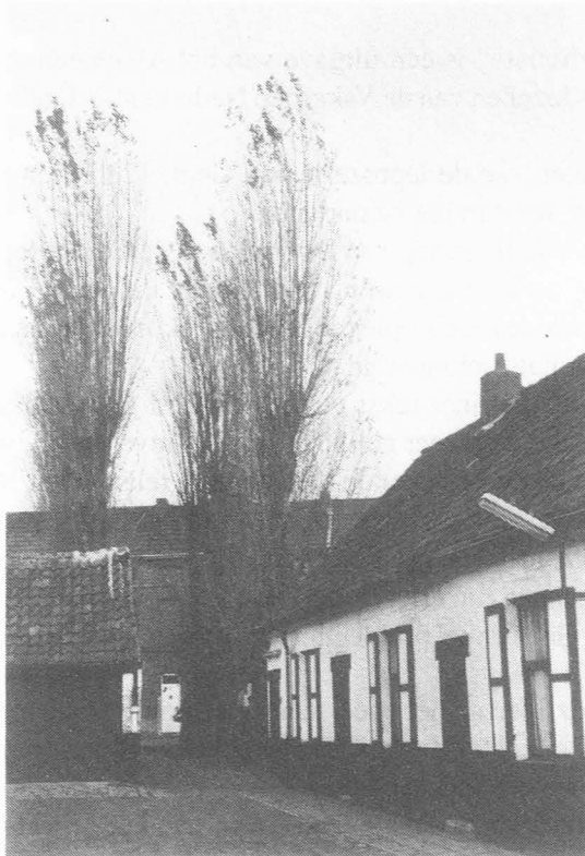
Het Hof van Barmhartigheid in de Peerstraat.

Het hof van Barmhartigheid, gelegen in de Peerstraat 81 tot 91, wordt aan het voorbijrijdend verkeer onttrokken door zijn licht verdoken bebouwing achter een typisch populierendreefje met kasseien.