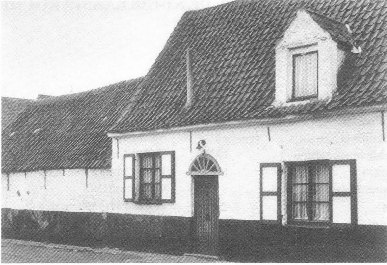
Het Hof van Barmhartigheid in de Peerstraat.

Als buurman van de nieuwe eigenaars vraag ik de leden van Ghendtsche Tydinghen ons te helpen met het vinden van informatie, zoals oude foto's, tekeningen en anekdotes, over het Hof van Barmhartigheid. Waarvoor onze beste dank.