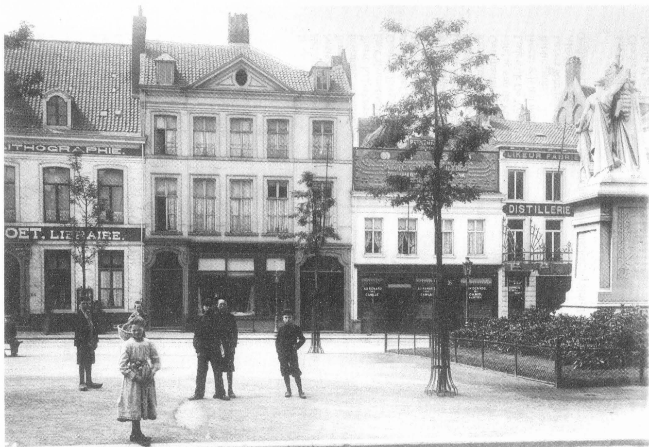
Het Sint-Baafsplein. Foto daterend uit het 1e kwart van de 20e eeuw. Het huis N° 14 is de Distillerie "Au Plumet d'Or" - Likeur Fabriek "In de Gouden Pluim". De uitbater Florimond Van Haesebrouck was de fabrikant van de gekende Gentse kersenlikeur "Plumet". Op de originele foto kan men duidelijk lezen "Gezondheids STOUT Guinness STOUT de Santé" waarvan hij de depositair was.