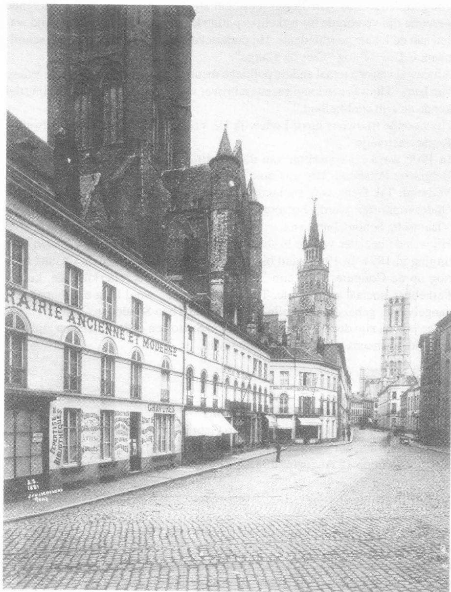
Boekhandel Van Goethem. Foto nr. 25982.