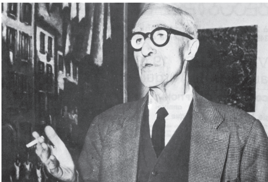
Frans Masereel (1889-1972)