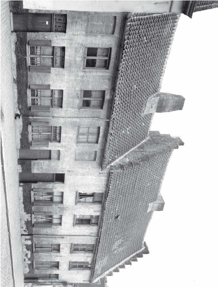
Verdwenen huizen in de St.-Lievensstraat (nu Lievenspoortstraat) Copyright A.C.L. Foto Nr. 28 112