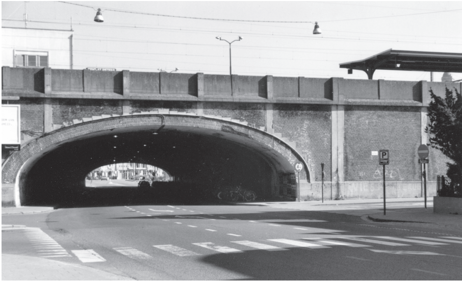
De viaduct naast het Sint-Pietersstation

De tunnel tussen de Sint-Denijslaan en de Afsneelaan is eindelijk voltooid.