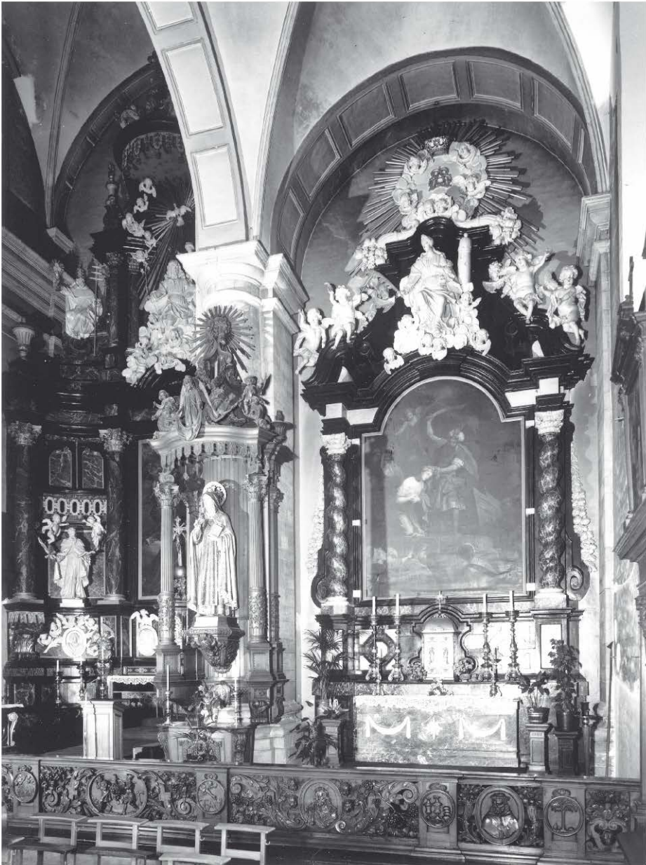
Kerk van de Discalzen - Interieur