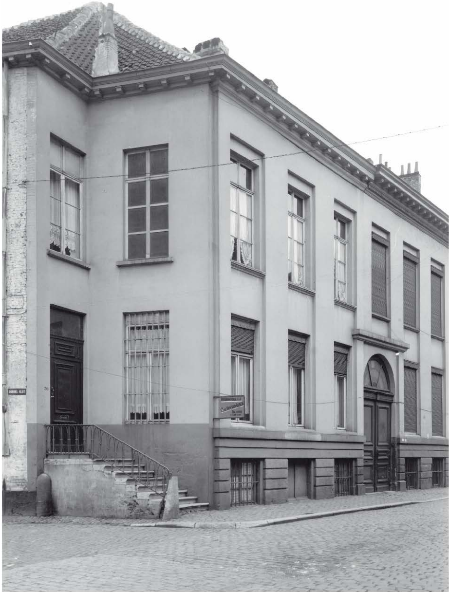
De St-Margrietstraat. Foto N° 34515