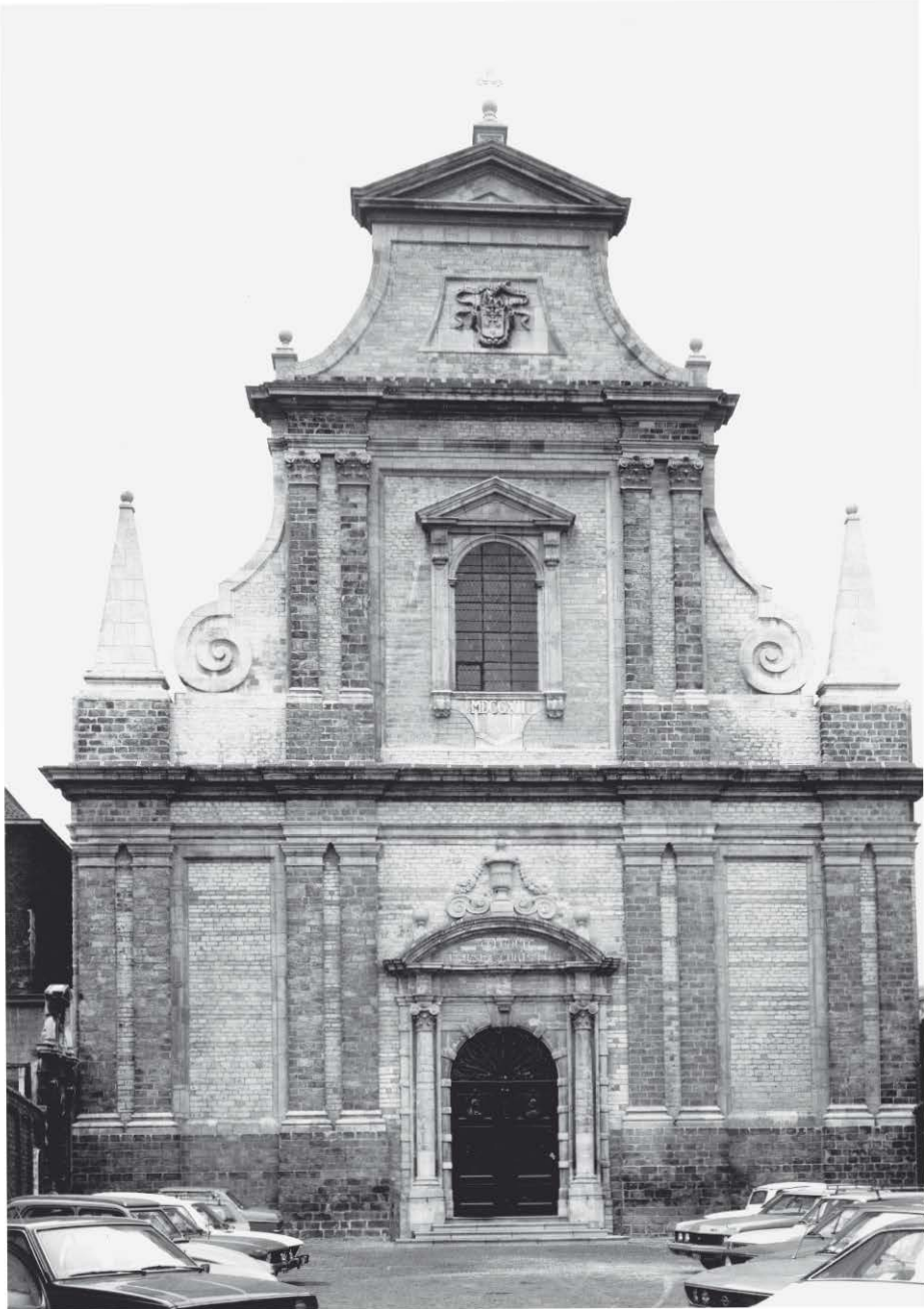
De kerk van de Discalsen in de Burgstraat