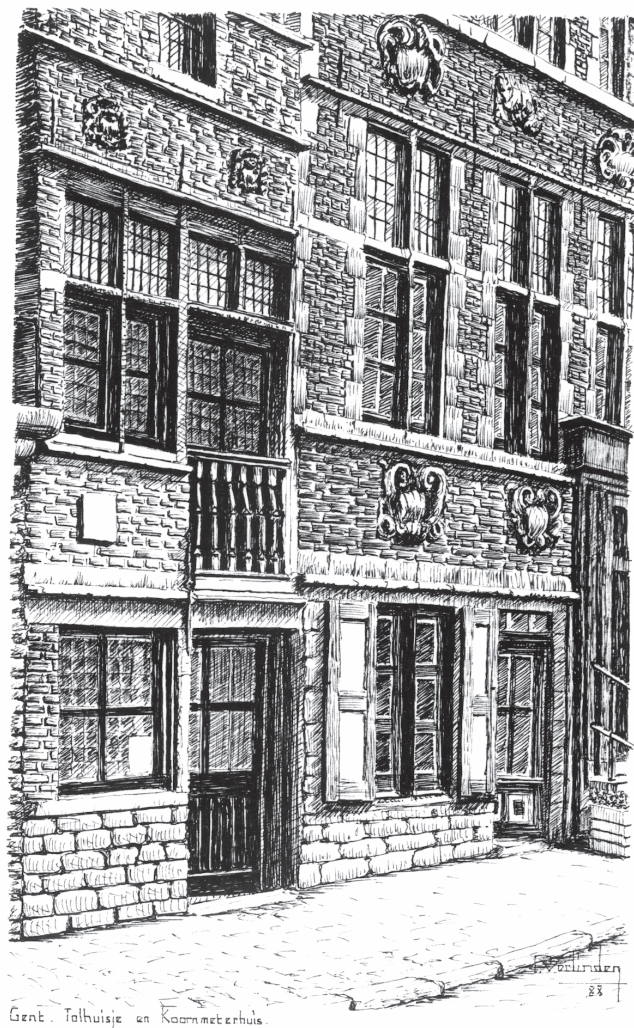
Het Tolhuisje op de Graslei