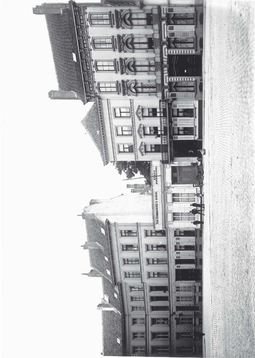
Huizen op het Sint-Michielsplein