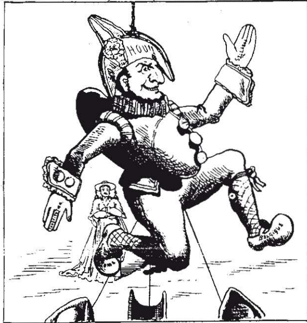
LE PARTI CLERICAL. — Ne tirez pas trop fort, car il serait vite détrempé.

Ook de liberalen stelden de tegenpartij voor als een willoze Janklaassen die door de Jezuiten gemanipuleerd werd. Zo verscheen in "Le Rasoir" van 1 juni 1878 deze spotprent met als onderschrift: "Trek niet te hard want ze zou wel eens kapot kunnen gaan."