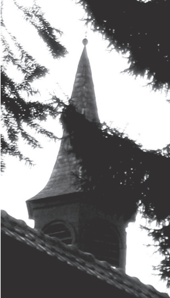
De klokkeruiter van de verdwenen Leeugemeetekapel

Opnieuw moest een oratorium gebouwd worden. Dit werd opgetrokken aan de pandgang langs de zijde van Theresianenstraat. Daar deze kapel, die sinds 1958 deel uitmaakt van het scholencomplex van H.T.I. St.-Antonius, geteisterd wordt door huiszwalm werden de muren om de ernst van de toestand vast te stellen ontleisterd. Langs de zijde van het slot bemerken we een dichtgemetselde deuropening, die toegang gaf tot de pandgang. Dit wijst er op dat dit bidhuis de oorspronkelijke kapel was van het kloosterslot. De huidige slotkapel is gelegen achter deze kapel.