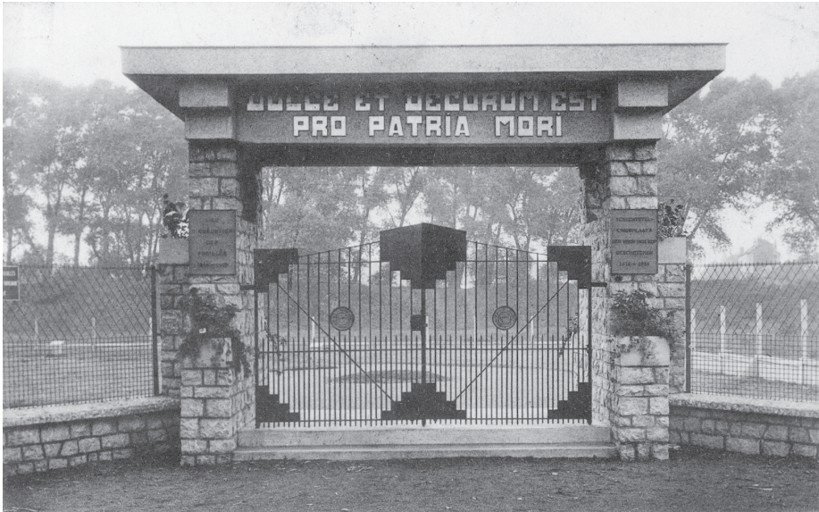
Oord der Gefusilleerden

Nederlanders, waaronder 3 vrouwen, gefusilleerd. Het werd na de Wapenstilstand ingericht als herdenkingsoord. Het werd geklasseerd in 1930 en door Koning Albert ingehuldigd in 1932. In 1943 werd het verwoest door SS-mannen die van Brussel kwamen.