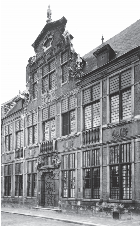
Gent, St.-Kathelijnestraat nr. 11, Huis de Pelikaan

Na onze publicatie over de geschiedenis van het Gentse Theresianenklooster tijdens het Ancien Regime 1 brengen we het relaas van de Gentse Theresianen op het einde van het Oostenrijks regime, tijdens de Franse omwenteling en de terugkering van deze religieuzen naar hun oud-klooster aan de Gentse Theresianenstraat.