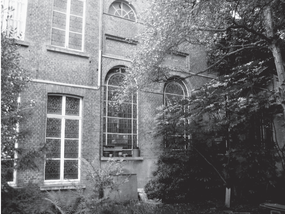
Het oude oratorium van de Theresianen (1843-1844), thans de kapel van H.T.I. St.-Antonius die binnenkort gesloopt wordt.

In 1795 werden de Zuidelijke Nederlanden officieel geannexeerd bij Frankrijk, waardoor de katholieke kerk aan banden werd gelegd.