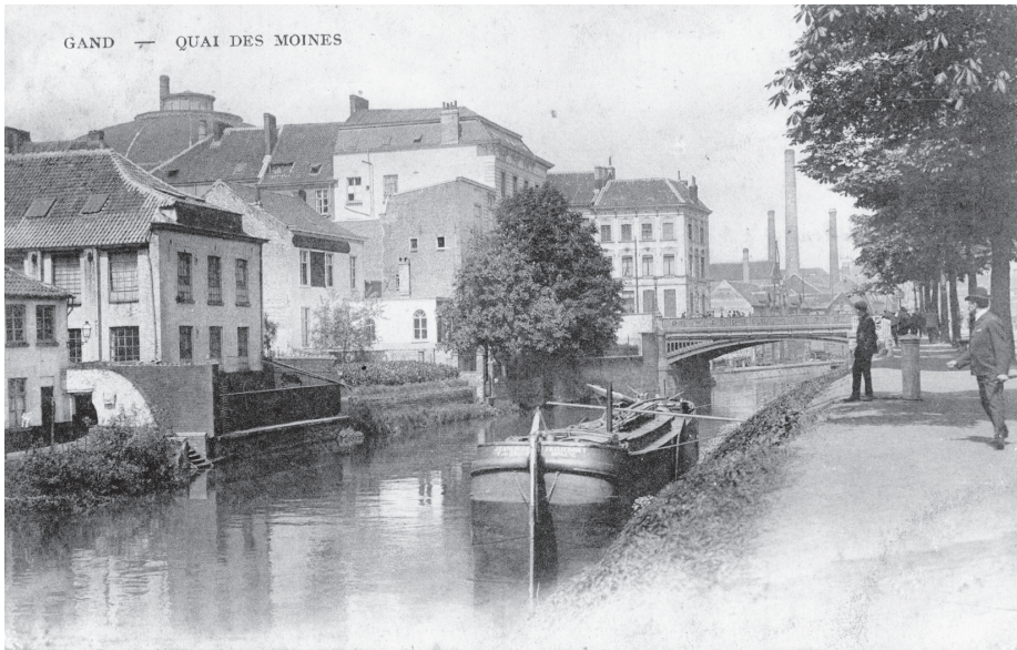
De Marcellisbrug, Model van 1866.

In de volksmond werd ze de “ijzeren brug” genoemd. Niet alleen was zij uit dit metaal vervaardigd, maar ze verbond ook dit hoger gelegen deel van de stad met den “ijzerenweg”. Wij zijn immers in 1844 en 7 jaar voordien was hier de eerste trein binnengestoomd aan het Zuid.