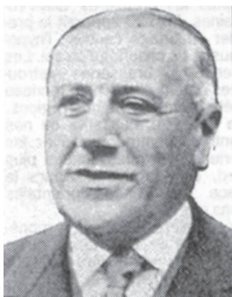
Victor Horta - 1861-1947

Deze stageperiode wordt meermaals onderbroken want in 1884, toen architectuurprijzen nog iets betekenden, ontving hij de Godecharlesprijs, wat hem toeliet studiereizen naar het buitenland te ondernemen.