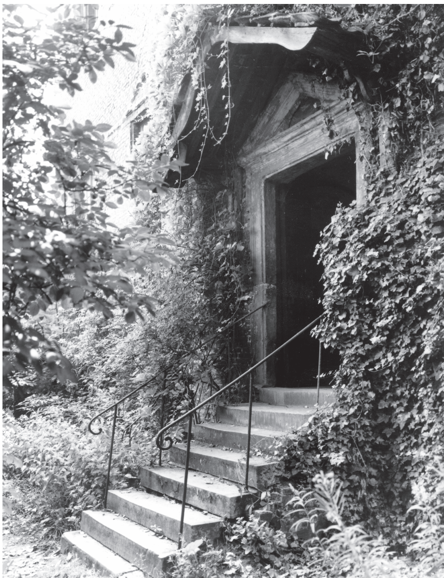
Entrée des artistes.

Een poëtisch zicht op de ingang van de gewezen Infirmerie van de Vrouwebroers, vóór de harde restauratie. Een geliefdkoosd oord van verschillende artiesten die er hun atelier hadden.