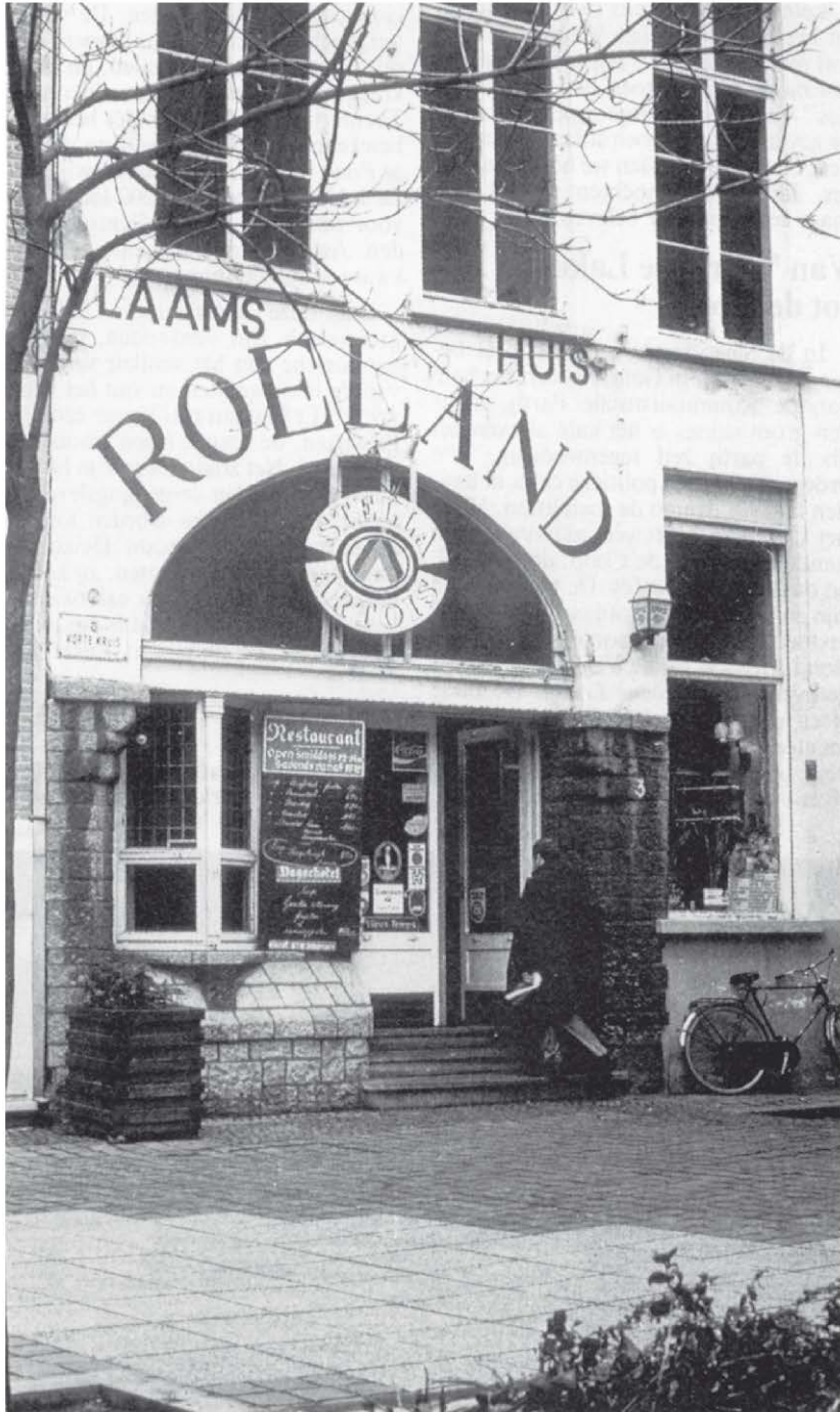
“Uilenspiegel” toen het al “Roeland” geworden was.