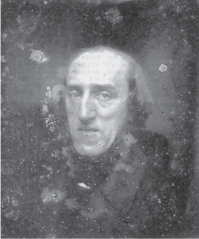
Jozef Plateau 1801-1883. Van hem bleef slechts één foto bewaard. Een daguerreotypie uit 1843.

met een dissertatie over “Enkele eigenschappen van de indrukken verwekt door het licht op het gezichtsorgaan”.