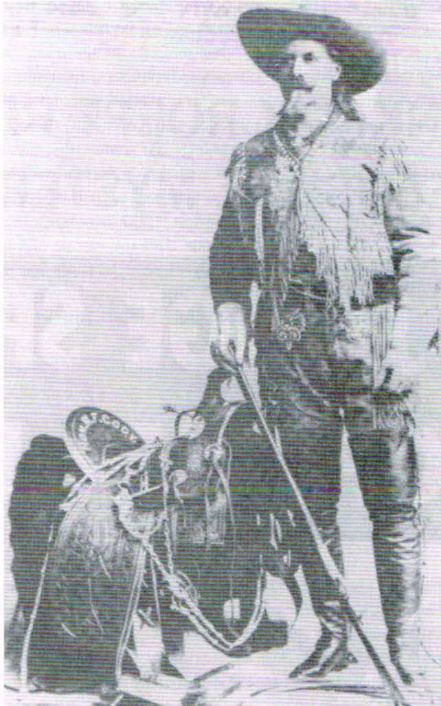
Buffalo Bill - 1846-1917.

Het gezelschap arriveerde 's nachts in het station aan het Arsenal en sloeg zijn tenten op op het exercitieplein. Alles in de puntjes en feilloos georganiseerd.