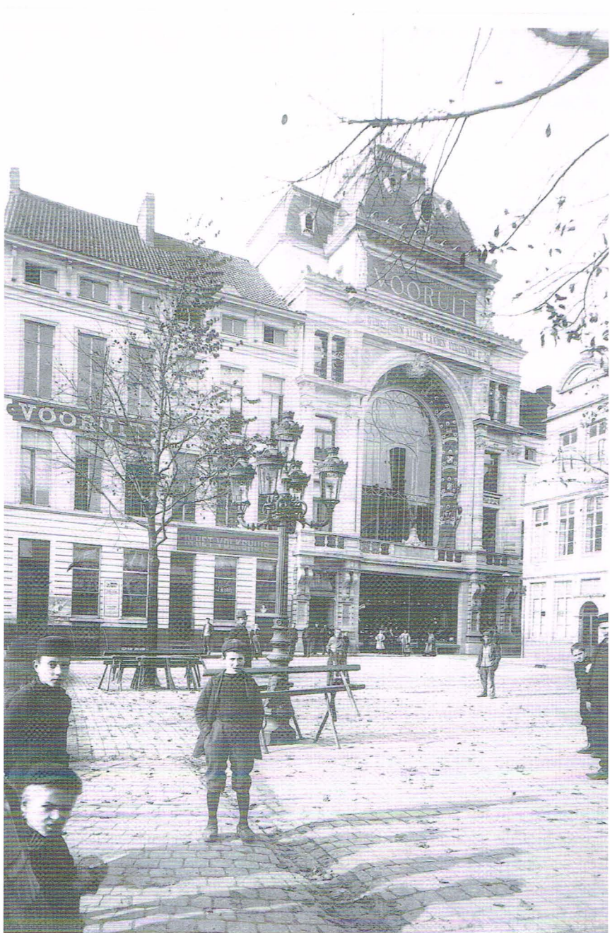
“Ons Huis” op de Vrijdagmarkt