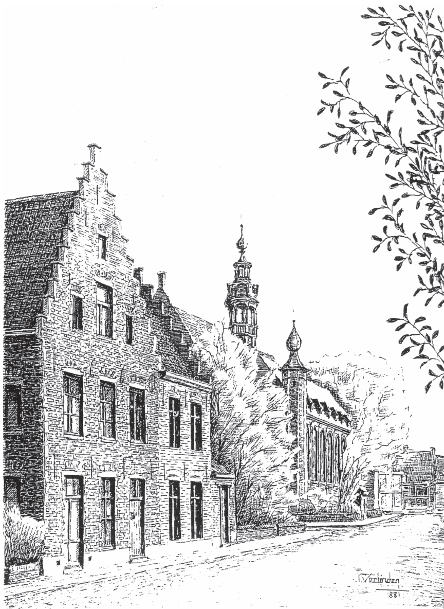
GENT 5 te Elzasstraat (Oude Begijnhof)

Huizen in het Oude Begijnhof. Getekend door ons lid Richard Verlinden.