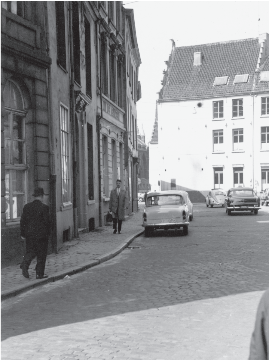
Foto genomen op 13-08-1960, kort voor de afbraak.