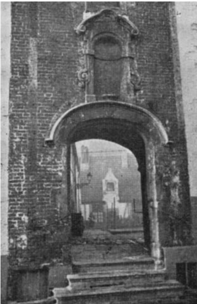
De ingang vroeger.

Men vraagt zich dan ook af hoe de proveniers die van hun kleine prebende moesten leven, dan ook in staat zouden geweest zijn om op volgend artikel van het reglement in overtreding genomen te worden: “Misseliken ofte costeliken geselscepe ende van onredelike conversatien en wandelinghen, van eten, drinckene, slapene, husene, hoven of van weerliken uterliken habytien die ten hospitale niet en behoorden”. Waar zouden zij wel het geld gehaald hebben voor die verballen buitensporigheden in kledij, eten of drinken?