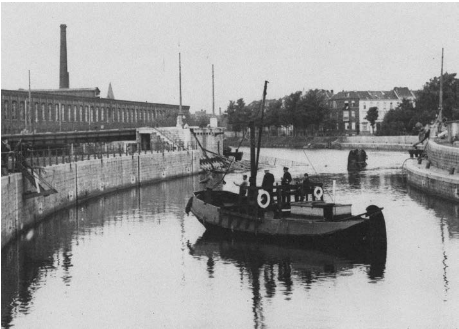
Onderschrift: Foto 1940.

Wie kan mij iets vertellen over de links op de foto staande fabriek? Naam? Bouwjaar? Jaar van afbraak en bouw UCO-vestiging?