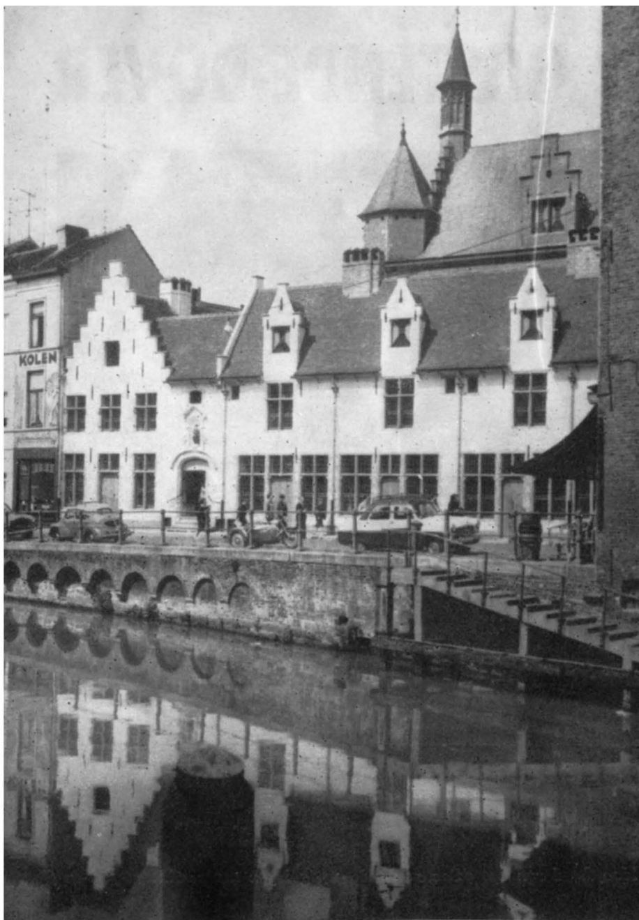
Het Kinderen Alijnhospitaal op de Kraanlei.