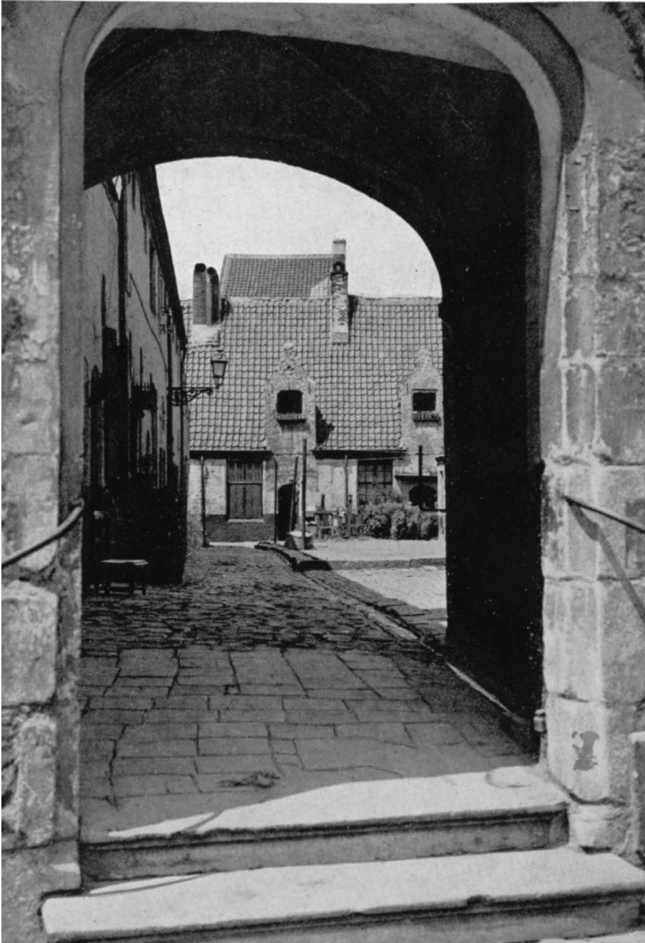
Het Kinderen Alijnhospitaal vóór de restauratie.