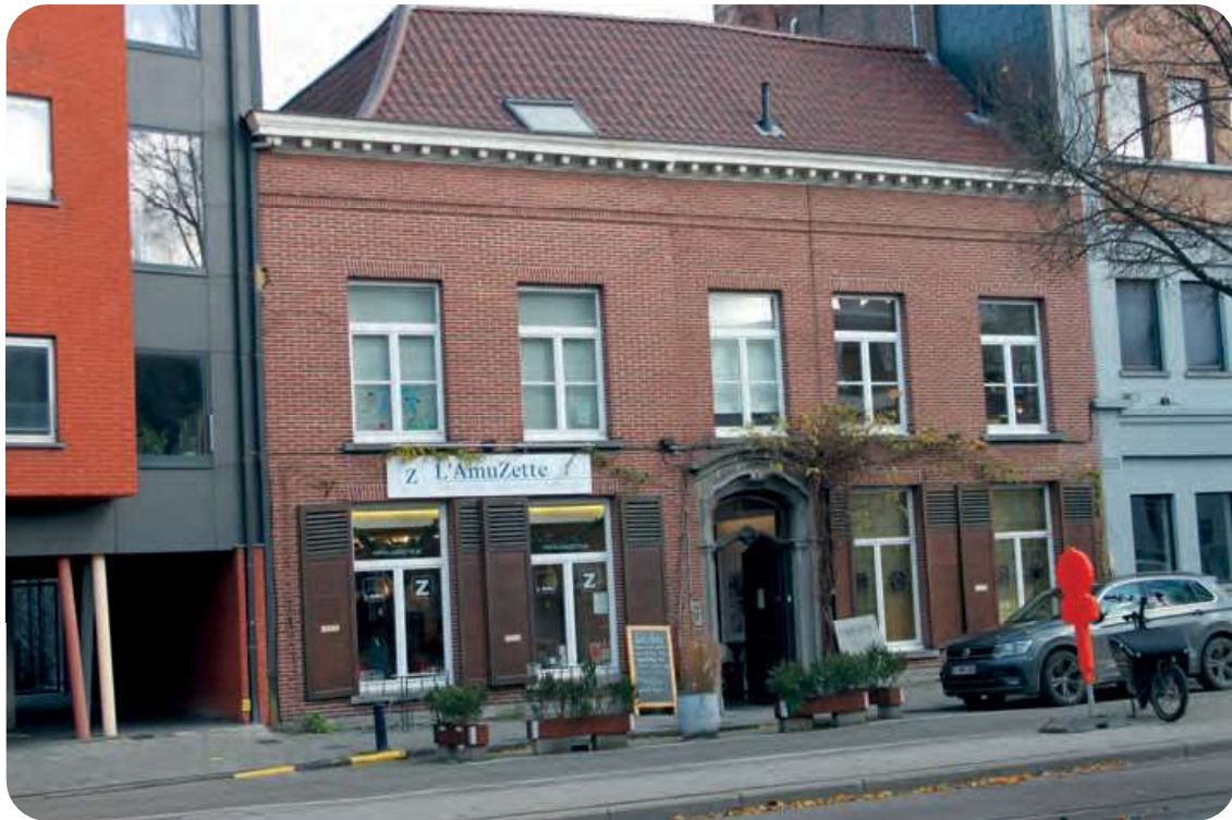
Afb. 6. Krommewal 2, het handelshuis van de familie Hoys.