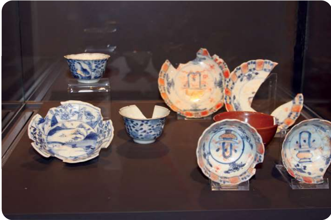
Afb. 2. Porseleinen kopjes en schotels uit India, gevonden bij archeologisch onderzoek in 1989-1991, rechtover het stadhuis.

(°Gent 25.10.1683 - †Gent 24.02.1741). Ze stopten er eigen kapitaal in en vonden nog een 20-tal andere goudvinken bereid om ook hun duit in het zakje te doen.