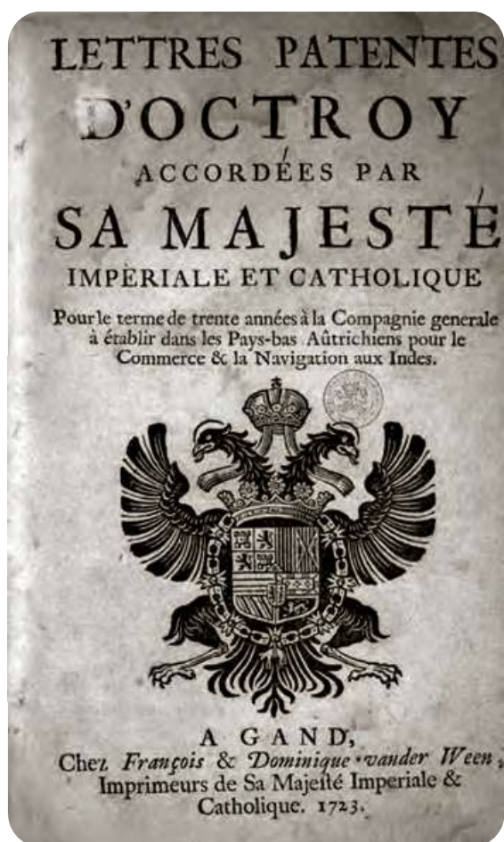
Afb. 1. Titelblad van het octrooi van de Oostendse Compagnie in 1722.

De Oost-Indische Compagnie van Nederland is alom bekend. Minder bekend is dat ook de Zuidelijke Nederlanden op zo'n lucratieve onderneming konden bogen: de Oostendse Compagnie. 300 jaar geleden, op 19 december 1722, ondertekende de Oostenrijkse keizer Karel VI haar octrooi. De aanzet ertoe vinden we al in de jaren ervóór. Zuid-Nederlandse handelaars en reders sloegen de handen in elkaar en organiseerden via de haven van Oostende private expedities naar Oost-Indië en China. Ook voor enkele Gentse ondernemers ging de boot los. Enkele namen en bijzonderheden.