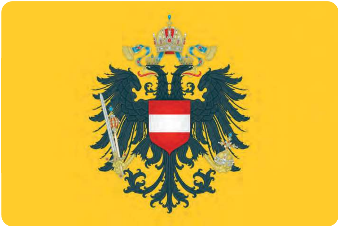
Afb. 7. Vlag van de Oostendse Compagnie.

Britten en Nederlanders lieten zich niet in het ootje nemen en stuurden oorlogsschepen af op de ‘Poolse’ schepen in Bengalen. Die gingen aan de ketting. Op 16 maart 1731 kreeg de Oostendse Compagnie het definitieve verbod om nog handel te drijven in Azië. Karel VI zwichtte om de Pragmatieke Sanctie veilig te stellen, het akkoord dat ervoor zorgde dat zijn dochter, Maria-Theresia, hem zou kunnen opvolgen. Vrouwelijke erfopvolging druiste immers in tegen de Salische wet.