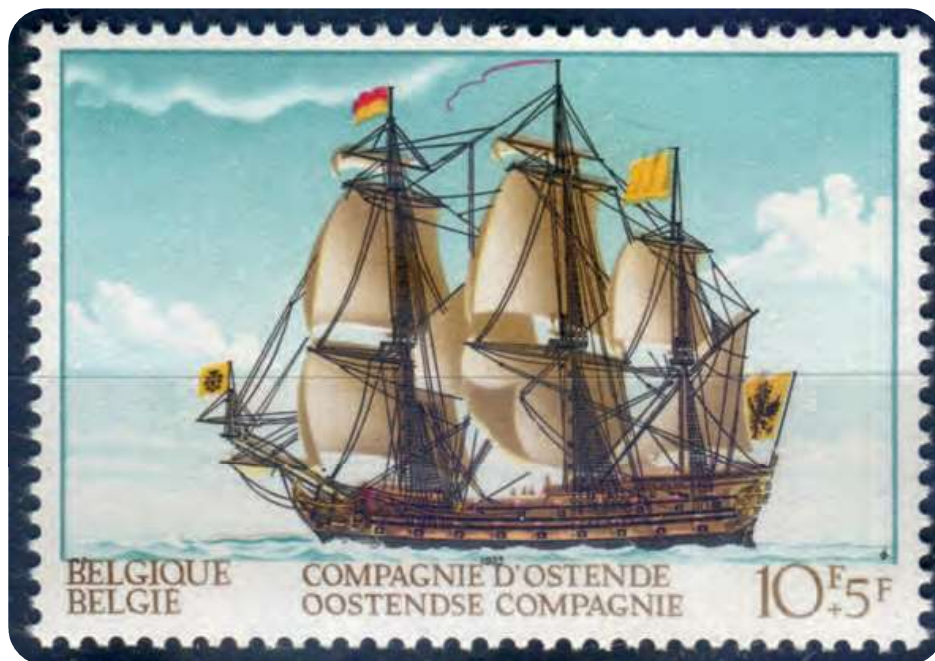
Afb. 3. Postzegel met afbeelding van schip van de Oostendse Compagnie.

Het begon niet goed voor Louis Bernaert (°Gent 29.11.1685 – †Oostende 09.11.1741). In 1708 werd het schip waarop hij meevoer voor de kust van Cadiz door Algerijnse piraten geënterd, alle bemanningsleden werden als slaaf naar Algiers afgevoerd. In 1710 vinden we hem echter weer alive and kicking in Oostende. Op zee waagde hij zich niet meer, maar hij zou later een belangrijke functie bij de Oostendse Compagnie verwerven: als boekhouder (commissionair) van 1723 tot 1732.