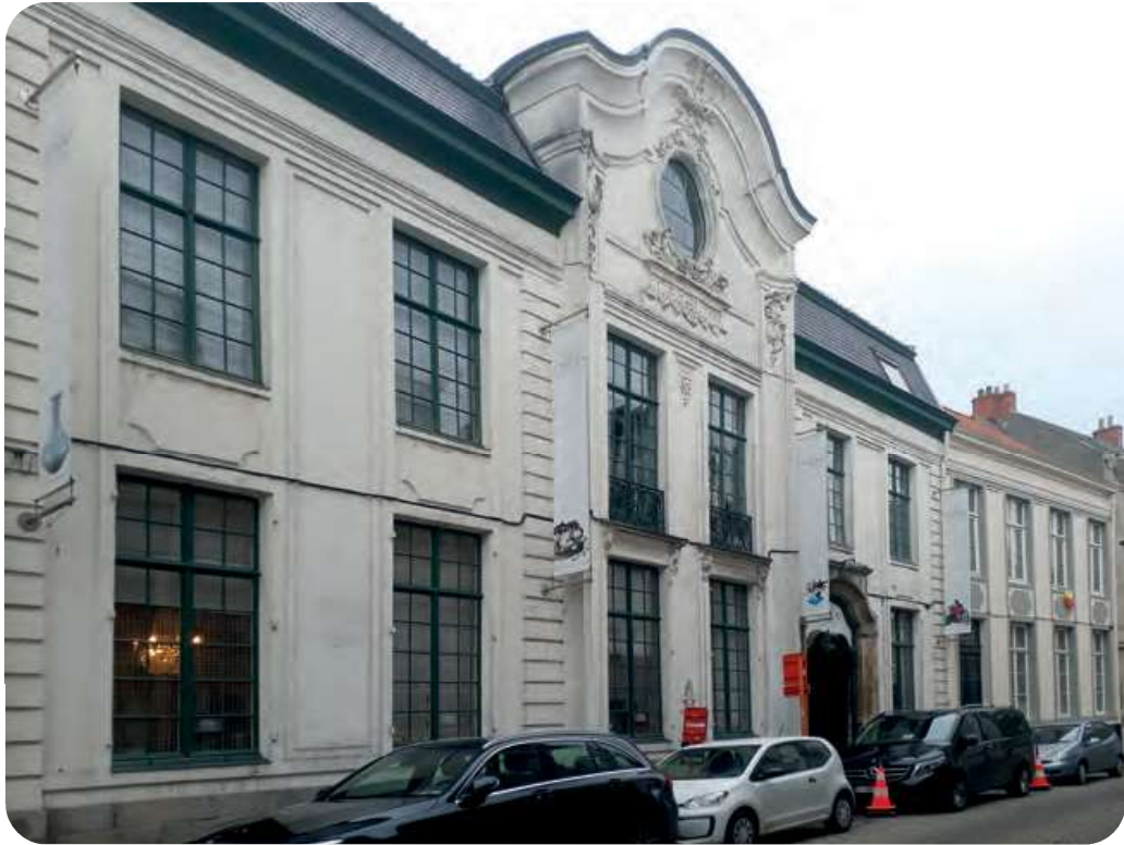
Afb. 4. Hotel Van Goethem, Ingelandgat 4, woonhuis van de administrateur van de OC met in het salon geschilderde marines met schepen van de Oostendse Compagnie.