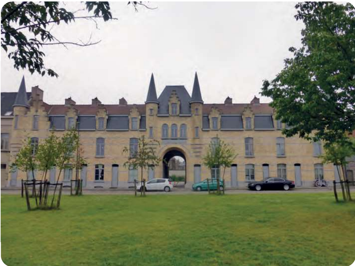
Afb. 4. Gezicht op het voorgebouw aan de Londenstraat, d.d. 2014.

In 1903 zou Welsch ook een hulpkas oprichten ter ondersteuning van noodlijdende brandweerfamilies. Iedere pompier stortte daarvoor 30 centiem in het fonds, maar, en daar was het de kapitein-kommandant eigenlijk om te doen, wie uit eigen beweging vertrok uit de dienst, zou het geld nooit terug zien. Met deze maatregelen hoopte hij zo de manschappen aan de dienst ‘te binden’. Het zou in de praktijk weinig uitmaken. De kas werd reeds in 1911 afgeschaft. De situatie zou pas verbeteren na de Eerste Wereldoorlog door structurele loonsverhogingen en een versoepeling van de militaire organisatie.