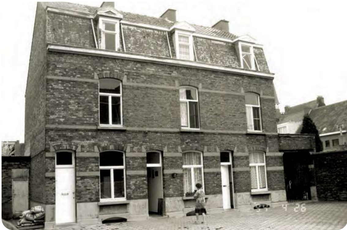
Afb. 6. Gezicht op drie brandweerwoningen op de binnenplaats, d.d. 1944.