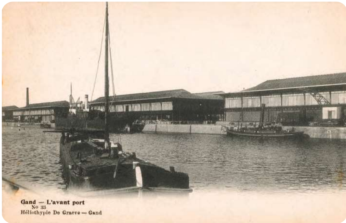
Afb. 2. Gezicht op de loodsen aan de Voorhaven, waar de brandweperlui patrouilleerden. Begin 20ste eeuw.