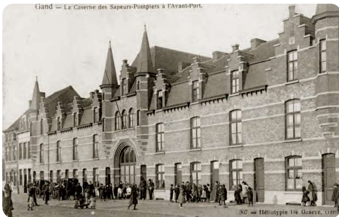
Afb. 1. De brandweerkazerne begin 20ste eeuw.

In 1902 opende de voorpost van de brandweer aan de voorhaven in de Londenstraat. Deze werd door stadsarchitect Charles van Rysselberghe ontworpen en gerealiseerd volgens de innovatieve inzichten en voorschriften van brandweercommandant Jacques Welsch. De bijhorende pompierwoningen werden opgevat met de bedoeling ze later eventueel te kunnen ombouwen tot sociale woningen, hetgeen effectief gebeurde na de verhuizing naar een nieuwe voorpost bij Roodenhuize.