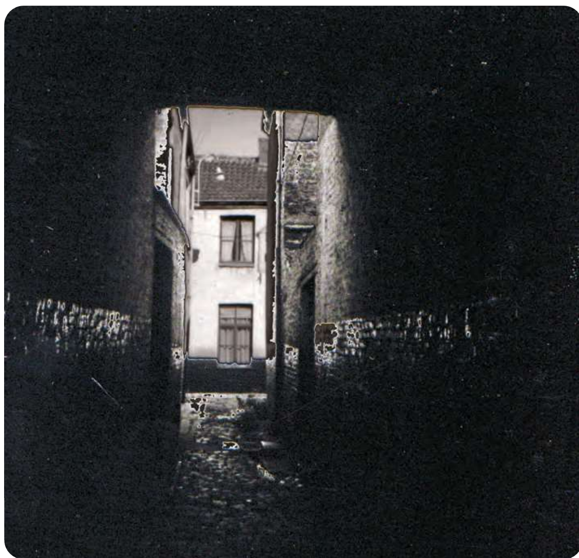
Afb. 2. Glurend in de nauwe gang (1,30m. breed) kon je een van de beluikhuisjes beter zien. De toegang was wel niet geschikt voor mensen met claustrofobie of met schrik voor overvallers.

Zoals in de meeste cités in die tijd woonden er weinig mensen in de erg kleine huisjes: drie hadden slechts één bewoner; veertien huisjes werden bewoond door twee mensen; zes door drie. Een dubbelhuis (twee huis- en kadastrum-