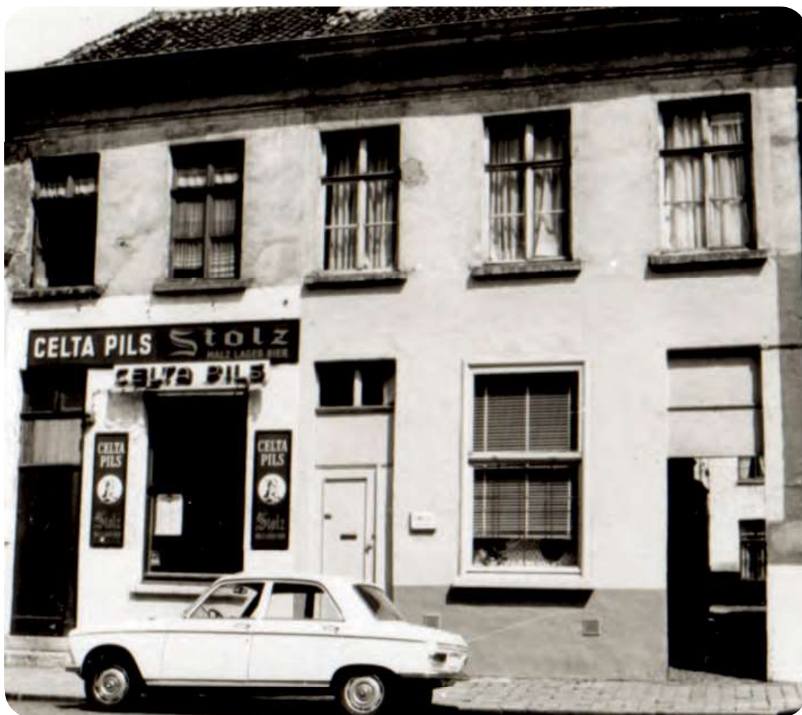
Afb. 1. In de Bagattenstraat stonden aan de straatkant naar het stadscentrum toe nog lang enkele onaanzienlijke huizen. In een ervan, naast het cafeetje, kon je doorheen de ingang rechts, een glimp zien van een van de beluikhuisjes. Als je het niet wist en er niet speciaal op lette, liep je er zó aan voorbij, zelfs als de gang niet afgesloten was met een deur of ‘poortje’.

Roghes typeerde het armoedige groepje huisjes als volgt: ‘Ga eens achteraan de mooie gevels kijken, zelfs in de middenstad. Riskeer je eens binnen de sleuf van een van die nauwe gangskes, die naar een binnenkoertje leidt. Waag je eens in die beluiken met hun brokkelige kasseien, oude vervallen waterpomp in het midden, en met een gezamenlijke ‘beste kamer’ (toilet), waarvan de geur uw neusgaten streelt. Ge zult ze ontdekken. En nog in ontzettend groot aantal.’