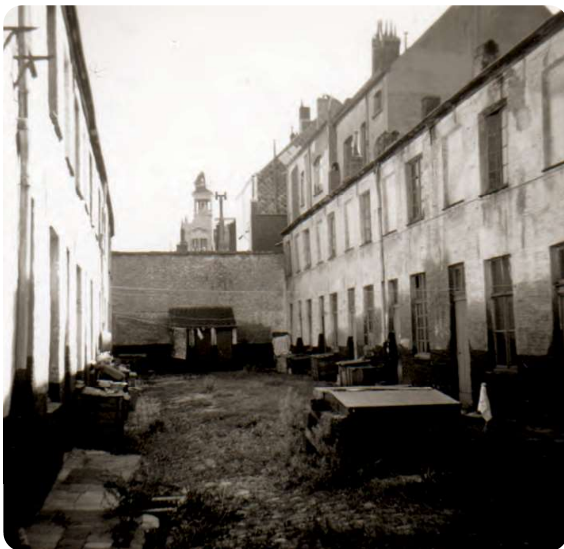
Afb. 3. De huisjes in een van de twee vleugels van het T-vormige beluik. De woningen waren van het iets betere type dan de oudere citéhuisjes. In de achtergrond: een ‘beste kamer’ (toiletten) met erboven, in de verte, een torentje van Feestlokaal Vooruit in de Sint-Pietersnieuwstraat.

De gegevens opgetekend voor een van de huisjes, met slechts één bewoner, geven het volgende beeld: gelijkvloers met linoleum (balatum) vloer en muren behangen met papier; verdieping met plankenvloer en gekalkte muren; trappen (met natuurlijke verlichting) in goede staat.