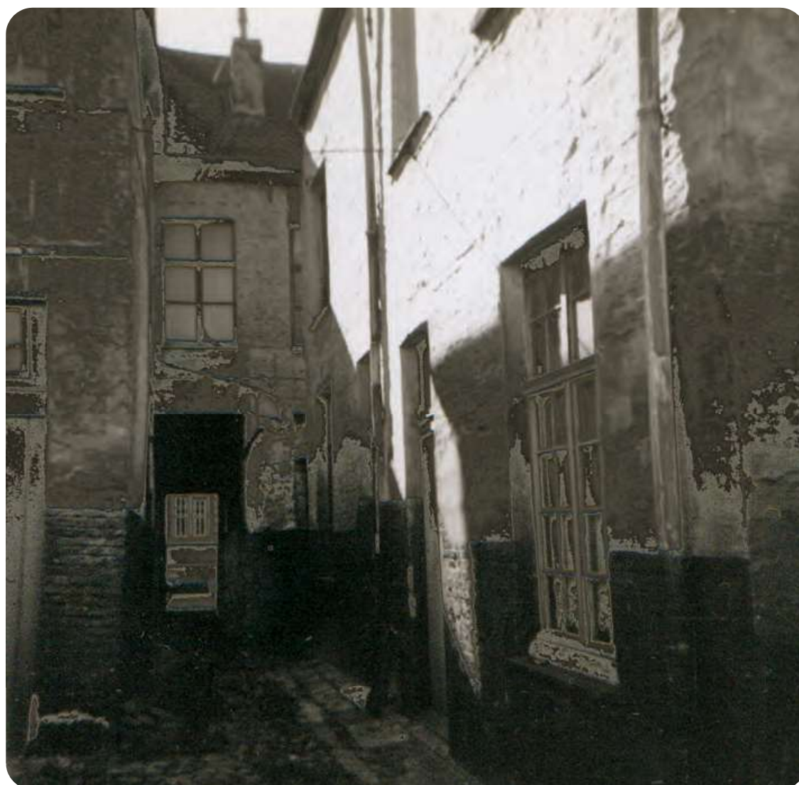
Afb. 4. In de cité, terugkerend naar de straat: opnieuw het gangske met in de achtergrond een stukje van een huis aan de overkant van de Bagattenstraat.

Erger was het gesteld met het gemeenschappelijk sanitair: het ene ‘vertrek’ telde twee zitplaatsen, het andere drie. In een ervan waren daarbij nog twee ‘pissijnen’ geïnstalleerd. Twee beerputten en één vuilbak moesten afval en excrementen opvangen. ‘Niet in orde’, schreef de inspecteur in zijn verslag, en ‘erg onzedelijk’. In een hoek van de koer zat er een rioolafvoer, altijd vol modder en niet geruimd. De bewoners beklagden zich bij de ambtenaar over het gedrag van de bezoekers van de toen blijkbaar drukbeklante cinema Vooruit. Die kwamen tijdens de pauze wateren (in de tekst: ‘hun gevoeg doen’) op de beluikkoer. Ook was er een bewoner die ‘vuiligheid’ (papier en vodden) stapelde in een hoek van de koer en op de verdieping van zijn huisje.