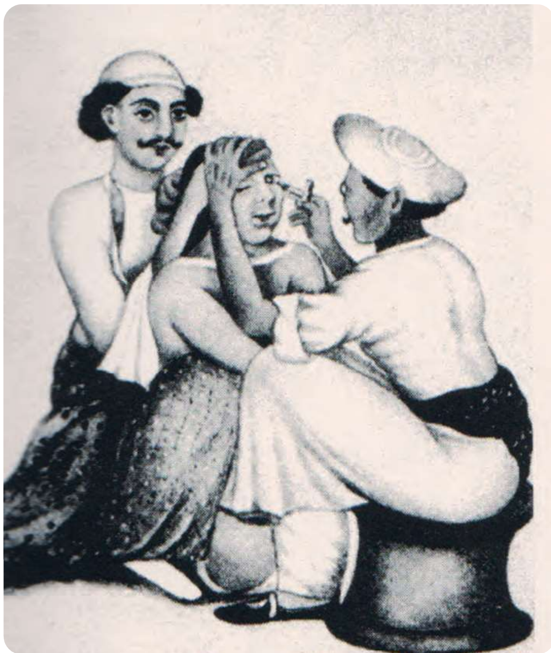
Afb. 1. Staaroperatie in het oude Indië. Indische aquarel uit de 19de eeuw. Bij Neetens (1990) overgenomen uit The British Journal of Ophthalmology , 1918, deel 2.