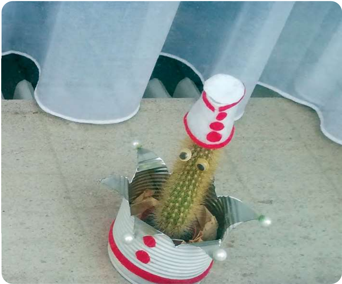
Afb. 9. Een stekelig Pierke achter een huisraam.

kunstzinnige poppen en de ongelooflijke inventiviteit en handigheid van de auteurs - spelers al of niet met poppen, stem, eigen lijf en leden in de meest fantastische combinaties. Kortom Figurentheater. Jammer genoeg ging die droomlocatie verloren toen de Provincie haar culturele werking moest afstaan aan de Vlaamse regering.