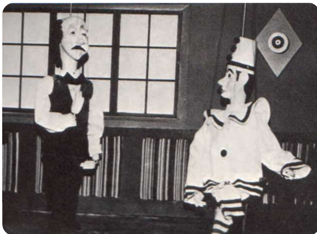
Afb. 7. In een heel ander gezelschap, maar nog steeds Pierke, onvervalsbaar: het poppenspel Fantasia in Heusden.