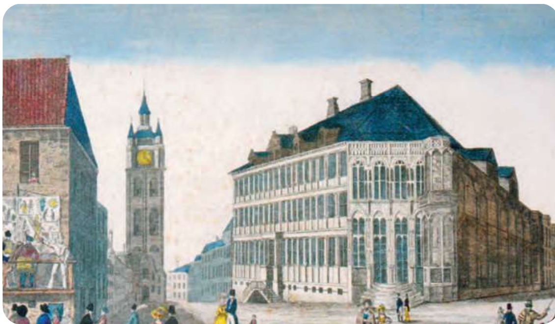
Afb. 1. ‘Optische prent’ (detail) overgenomen uit Van Doorne (1995) naar een exemplaar te dateren ca. 1830, bewaard in de Zwarte Doos. De zanger verkleed als Pierrot in de outfit die we veel later terugzien bij Pierke. Het huis waartegen de rolprent ophangt, is het Sint-Jorishof, nog in verminkte vorm, vóór de restauratie. De voorstelling gaat door in open lucht, niet ergens in een bedompte kelder, of op een stinkende zolder. Ook niet op een groezelige markt, maar in het hartje van de stad rechtover het Stadhuis, met duur geklede toehoorders, rijke dames en heren. De artiesten kunnen buitenlanders zijn: Fransen, Italianen?

Hoe kwam het zeer herkenbaar uitgedoste Pierke in Gent terecht en hoe is het te verklaren dat het ventje er zo populair werd? Twee hierbij gereproduceerde, bijna tweehonderd jaar oude versies (afb. 1 en 2) van een afbeelding van een straattheatervoorstelling lichten een tip van de sluier op. Ze zijn gemakkelijk lokaliseerbaar aan de Gentse Hoogpoort bij de Schepenhuisen, tegen de gevel van het Sint-Jorishof. Afb. 1 werd gemaakt naar een gekleurde, zogenaamde optische prent (prent met gezichtsbedrog in verwerkt), en moet van rond 1830 dateren. De prent in afb. 2 werd in 1825-1830 vervaardigd. Een Pierrot, in het wit gekleed en met hoge puntmuts op het hoofd, duidt met een stok op een tegen de gevel gehangen ‘rolprent’ de taferelen aan die hij bezingt of vertelt. Dergelijke, soms ellenlange liederen werden ‘stokliederen’ genoemd.