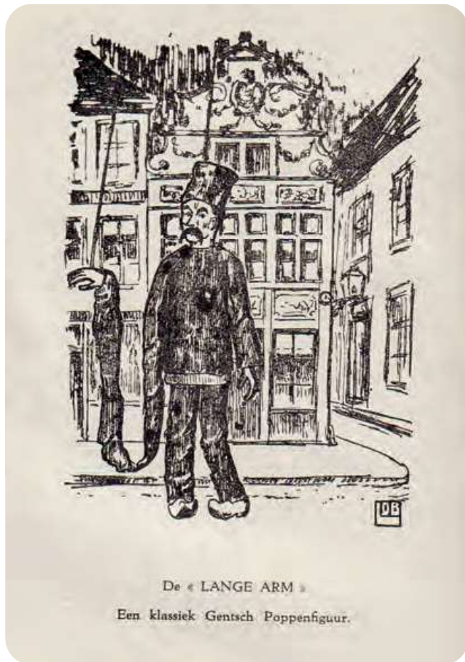
Afb. 6. De Langen Arm, hier in de gedaante van een van Pierkes compagnons in een decor dat de ingang van het Patershol aan de Rode Koningstraat lijkt voor te stellen. Uit 'De Magie van het Poppenspel', 1943.