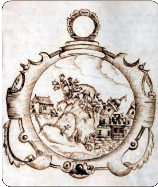
Afb. 4. Geestige spotprent uit het Physica-dictaatschrift van een student uit 1662. In dit embleem van de pedagogie Het Varken eet het Varken De Lelie op, vertrappelt het De Valk en belegert De Burcht met een spervuur van drollen. Die drie waren de concurrerende pedagogieën. Uit: Vensters op Leuven, 2019, p. 45.

Zowel in het college als in de pedagogie heerste een streng regime. Nodeloos lawaai maken, ruzie zoeken, de studies verwaarlozen, te lang wegblijven uit het college, alleen op pad gaan in de stad, herbergen bezoeken enz., werden niet getolereerd en betrachte overtreders werden streng gestraft. De normale straffen waren geldboetes, het ontzeggen van een maaltijd en in het ergste geval verlies van de beurs en wegzending uit het college, ‘zodat één ziek schaap niet de hele kudde zou besmetten’. Het belangrijkste moment van ontspanning was de tijd na het avondmaal. Er mocht dan gemusiceerd en gezongen worden, maar dan vooral gregoriaanse en kerkelijke gezangen.