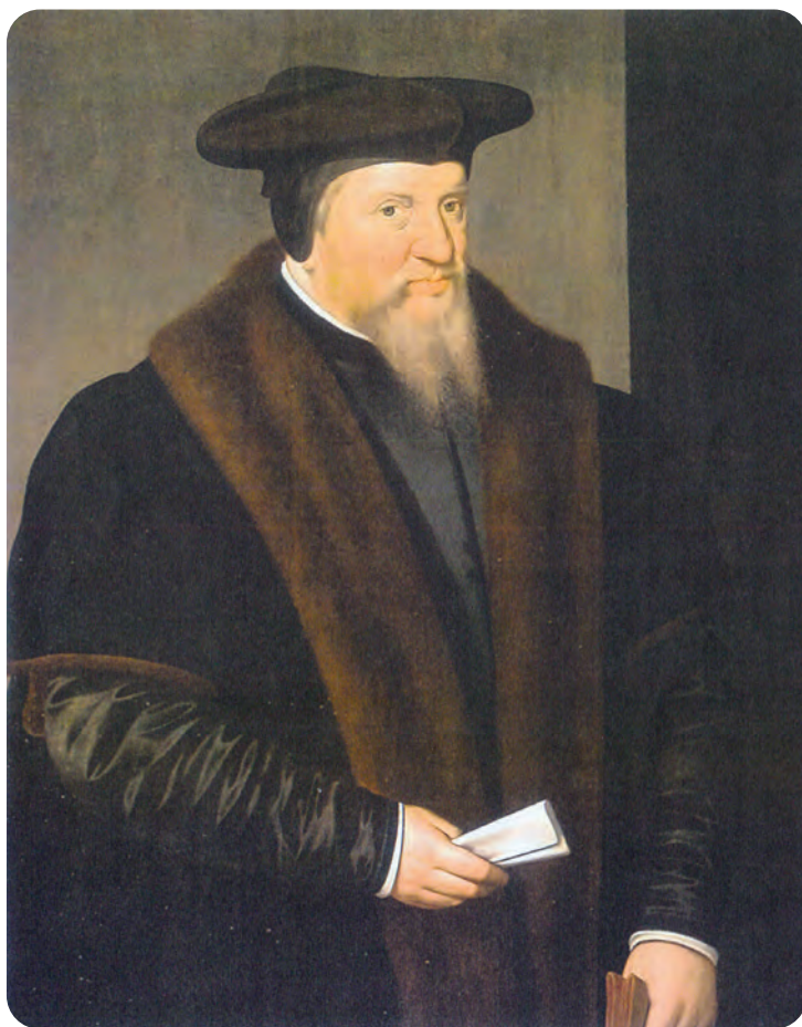
Afb. 1. Viglius van Aytta, geschilderd ca. 1565 door Frans Pourbus de Oudere (1545-1581), die uitblonk in de portretschilderkunst. Viglius wordt hier afgebeeld als geleerde professor met een doctorsmuts op zijn hoofd.

behaalde zijn doctoraat in de rechten in Valence (1529) en gaf les in Padua en Ingolstadt. Hij raakte goed bevriend met Erasmus, de stichter van het Drietalencollege, en met Nicolas Perrenot de Granvelle (1484-1550), die hem in 1542 binnenloodste in het ambtelijke netwerk van de Habsburgse staat. In 1547 werd de Fries voorzitter van de Geheime Raad en chartermeester van Vlaanderen. In 1584 werd hij zelfs president van de Raad van State, waar hij als niet-adellijke jurist een vreemde eend in de bijt was, maar niemand betwistte zijn uitzonderlijk juridisch en politiek talent.