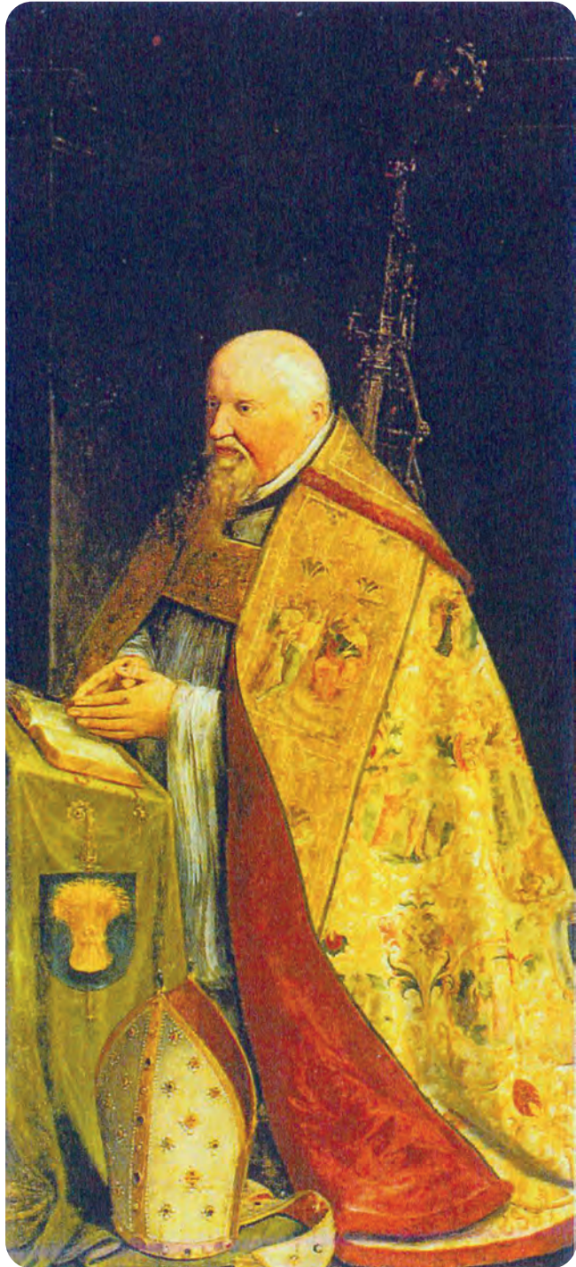
Afb. 5. Op het klee van de zitbank: het wapenschild van Viglius met korenschoof. Deel van een triptiek, met de ouder geworden opdrachtgever Viglius van Aytta. Als proost draagt hij de geborduurde koorkap met de legende van de heilige Katharina van Alexandrië, patrones van de filosofen. Gent, Sint-Baafskathedraal, inventarisnr. 440.