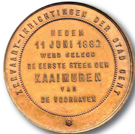
Afb. 5. Precieze aanduiding van het 'waarom' van de Eerste Steenlegging op 11 juni 1882 op de Gentse medaille.