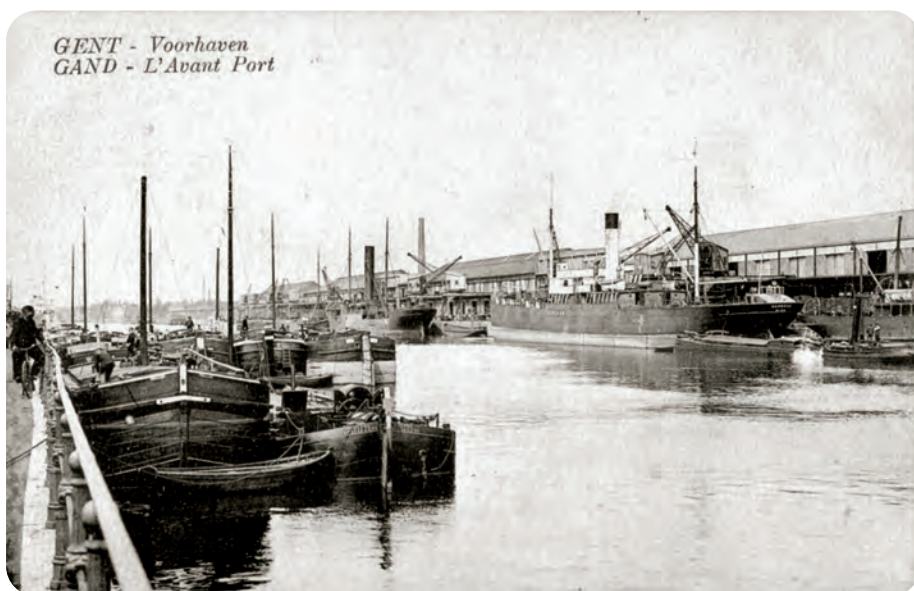
Afb. 1. Gezicht op de Voorhaven vanaf de Wiedauwkaai. Aan de andere zijde: de loodsen waarvan er twee bewaard bleven en gerestaureerd werden voor hergebruik. Samen met hun omgeving vormen ze het grootste Gentse stadsgezicht.

Een onmiskenbaar Brusselse gedenkpenning, met de duivel dodende stadspatroun Sint-Michiel, uitgegeven door de vereniging ‘Le Waterzoei de Bruxelles’ vermeldt als te gedenken gebeurtenis het leggen van de ‘tweede steen’ voor de Gentse maritieme installaties in 1882. Die was bestemd voor de bouw van de kaaimuren van de Voorhaven, die in dit artikeltje kort beschreven en geïllustreerd wordt. In een tweede bijdrage, eveneens in dit GT nummer, wordt uit de doeken gedaan hoe de Brusselaars er toe kwamen deze Gentse gebeurtenis te gedenken.