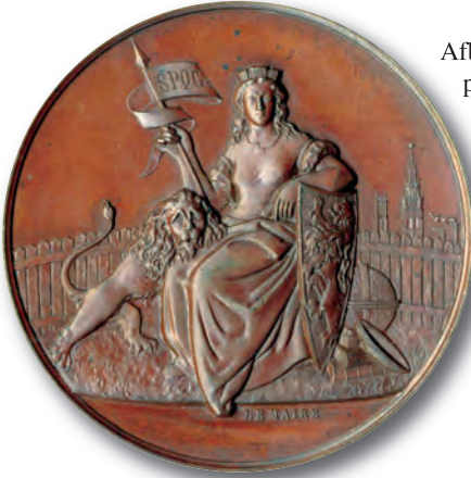
Afb. 4. Voorzijde van een overduidelijk Gentse erpenning met de stedelijke maagd en haar attributen. Meer uitleg over deze dame in de hoofdttekst.

Gentse maritieme installaties te zien? Deze vragen pogen we te beantwoorden in een apart GT artikeltje over Gentse en Brusselse waterzooi en de Brusselse Gentenaar Charles Verbessem.