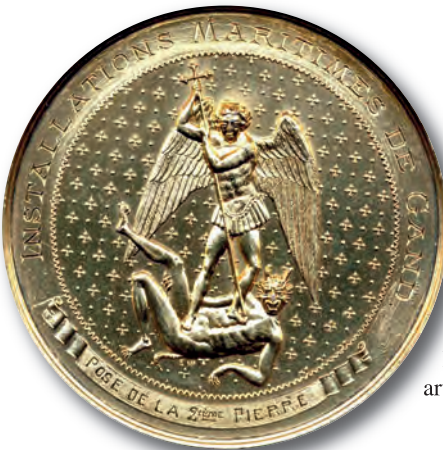
Afb. 6. Voorzijde van een tweede gedenkpenning voor dezelfde gebeurtenis.

Onmiskenbaar Brussels: met de gevleugelde aartsengel 'Sint' Michiel, die met een lans, bekroond met een kruis, de doodsteek toebrengt aan een duivel vertrapveld onder zijn voeten. Randschrift met de Franse naam van de Gentse Zeevaartinrichtingen en ... 'Pose de la 2 i ème Pierre'. Meer hierover in een ander artikeltje in dit GT nummer.