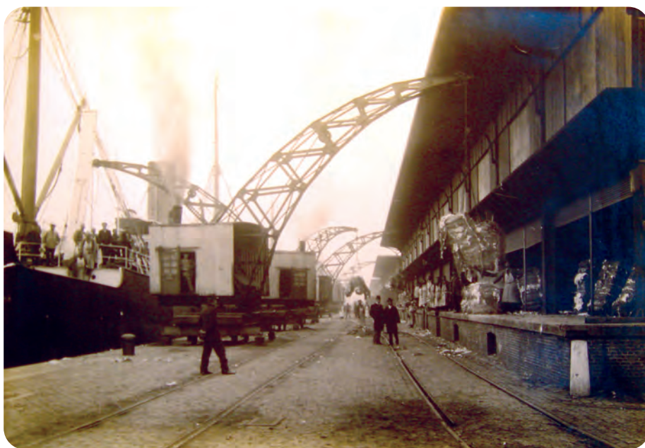
Afb. 2. De Voorhaven in volle activiteit: het lossen van de typische katoenbalen, uit een scheepsruim door kranen gehesen op de loskaai van de loodsen. Het lossen moest snel gebeuren, maar in de hangars konden de balen nog een tijdje blijven liggen tot ze verder naar de fabrieken in de stad vervoerd werden.

Sinds de aanleg van het Kanaal Gent-Terneuzen in 1827 onder impuls van Willem I beschikte Gent over een volwaardige zeehaven met als zwaartepunt het Handelsdok bij de Dampoort. Veel later werden (en worden nog steeds) talrijke bijkomende werken uitgevoerd. In de negentiende eeuw was de belangrijkste daarvan de aanleg van een nieuwe Voorhaven, onmiddellijk volgend op de voltooiing van het in GT 2021 nr. 4-5 beschreven Houtdok. De Voorhaven, goed uitgerust met kranen en overdekte katoenstapelhangars (afb. 1 en 2), was nog indrukwekkender: de kaaimuur mat meer dan 1.000 meter. Dit deel van de haven liep in bijna rechte lijn uit in het Zeekanaal Gent – Terneuzen (afb. 3), en was aan het andere uiteinde verbonden met de Handels- en Houtdokken en het Verbindingskanaal (de Nieuwe Vaart) naar de Coupure en de Brugsevaart uit 1863. Op die waterverbindingen krijg je nu nog steeds een uitstekend gezicht vanuit de tram voorbij de Tolhuisstuw en ter hoogte van de Muidebrug.