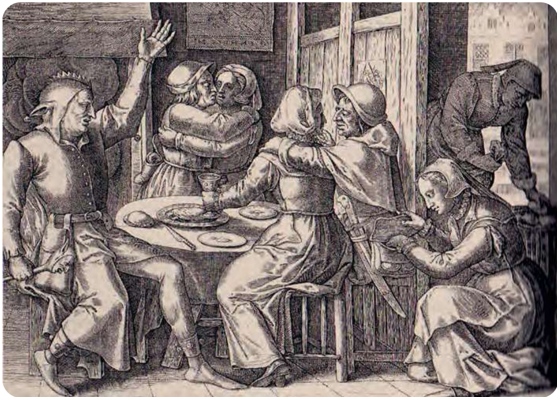
Afb. 4. Tafereel in een louche herberg. Een deerne zit in de beurs van een dronken en vrijende klant. Gravure naar Quinten Matsys, Koninklijke Bibliotheek, Prentenkabinet. Uit Vanhemelryck (2004).