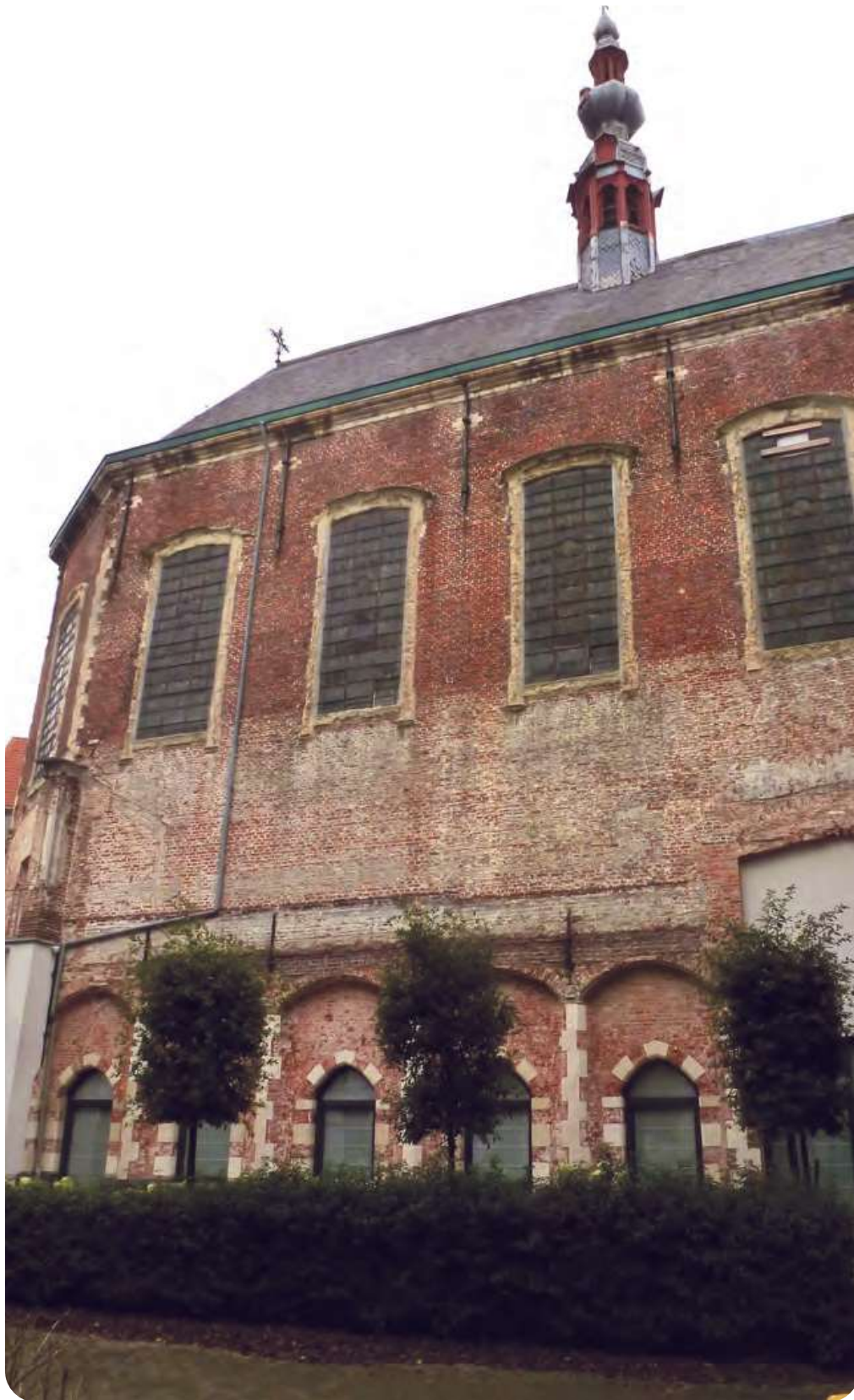
Afb. 6. Dezelfde kapel gezien vanop de opgevolde Oude Houtlei (foto 2021). De benedenverdieping – de eigenlijke vestmuur – is hier gedeeltelijk open gemaakt en voorzien van kleinere vensters.