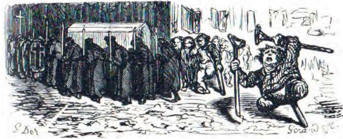
Afb. 1. Rijke begrafenis, vermoedelijk in een kerk, met priesters, (kostbare!) kaarsen, lijkdragers... en invalide bedelaars. Tekening van Gustave Doré (1832 – 1883) in: H. de Balsac (1799 - 1850), Les Contes drolatiques , 13de uitg., Garnier, Parijs.

bruikt waren als gevangenis en collocatiehuis, waarin vermogende families al of niet vermeende krankzinnige leden lieten opsluiten. De tijdgenoten stonden in het algemeen positief tegenover de broeders, omdat ze in hun ogen onaangenaam maar noodzakelijk werk deden, taken waarvoor de meeste mensen hun neus ophaalden.