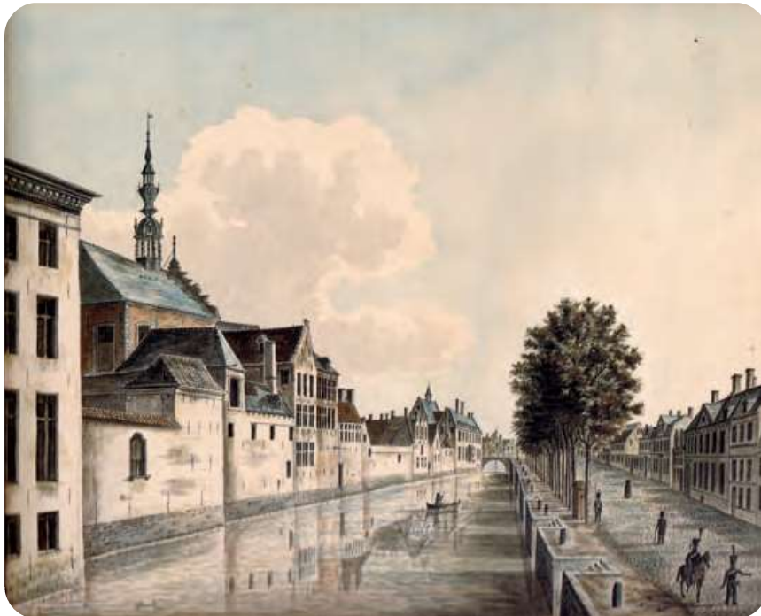
Afb. 3. Zicht op het klooster van de alexianen ca. 1820. De broeders waren toen al ruim twee decennia eerder door de Fransen uit hun klooster verdreven. De kapel met barokke dakruiter werd in 1681 ingewijd. Ook de vleugel met de trapgevel dateert uit de 17de eeuw.

De broeders van de christelijke scholen verwierven het complex in 1863.