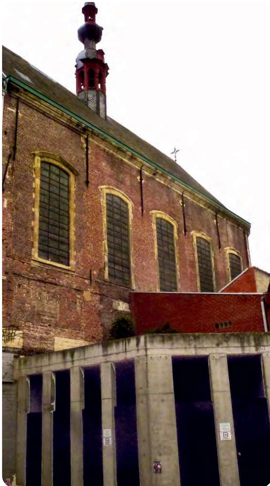
Afb. 5. Actueel gezicht op de alexianenkapel op een foto in 2021 genomen op de binnenkoer van de Residentie Collegehof aan de Sint-Michielstraat. De typisch barokke kapelvensters werden veel hoger dan normaal aangebracht. We zien ze in een schijnbare verdieping, beneden geflankeerd met betonnen nutsruimten. Deze werden tegen de vroegere vest aangebouwd. Voor een verdere beschrijving van deze eigenaardige site met verplaatste barokke poortomlijsting (niet in beeld): zie Devriese (2019).