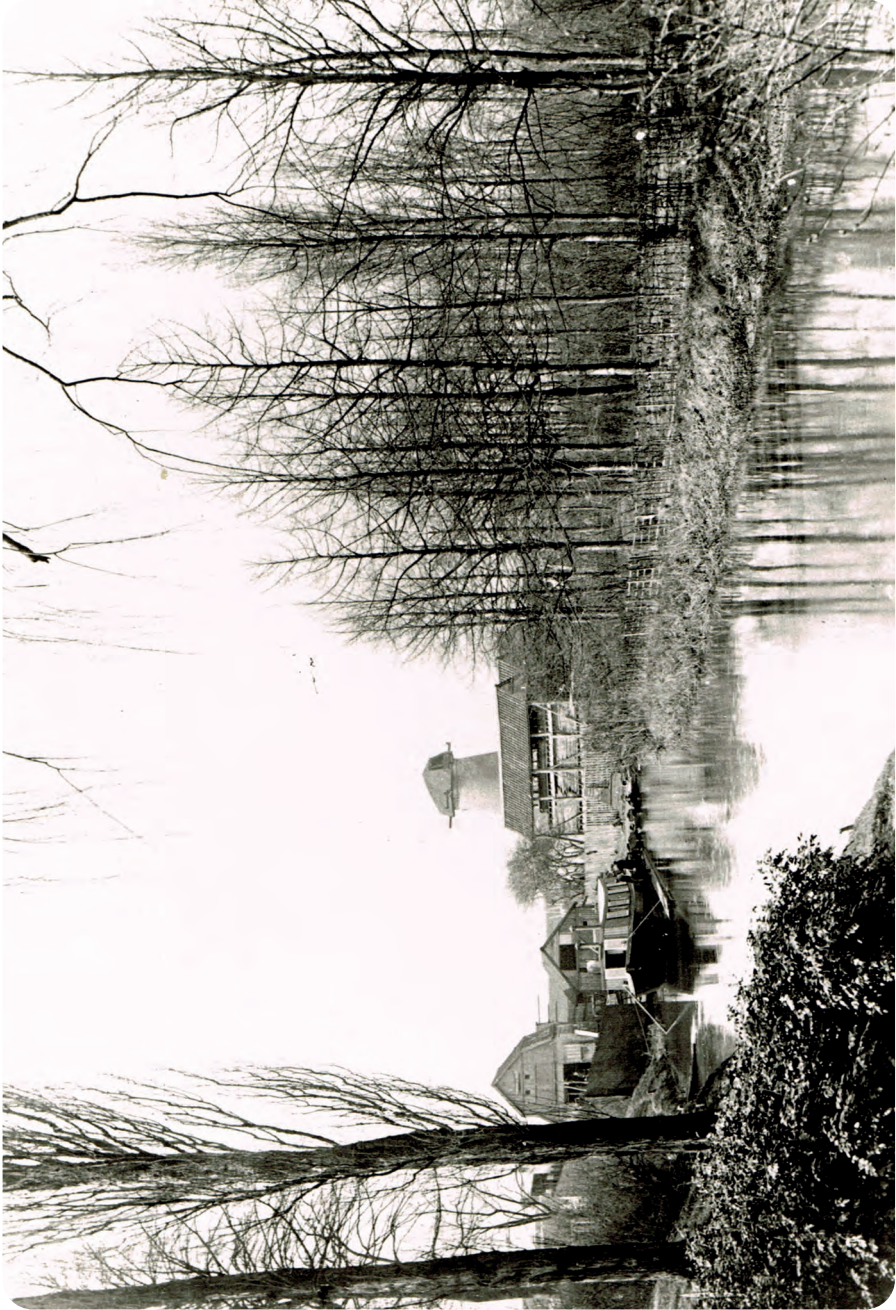
Afb. 2. Hetzelfde bedrijf gezien vanop het water, waarop een woonboot met bovendecks opgebouwde woonruimte (ongedateerd).