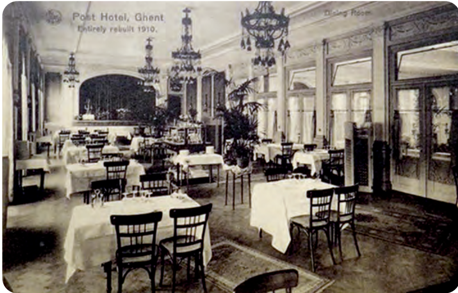
Afb. 7. Eetzaal. De positie van de orkestbak achteraan maakt duidelijk dat het hier gaat om de ruimte die initieel als balzaal was ingericht.