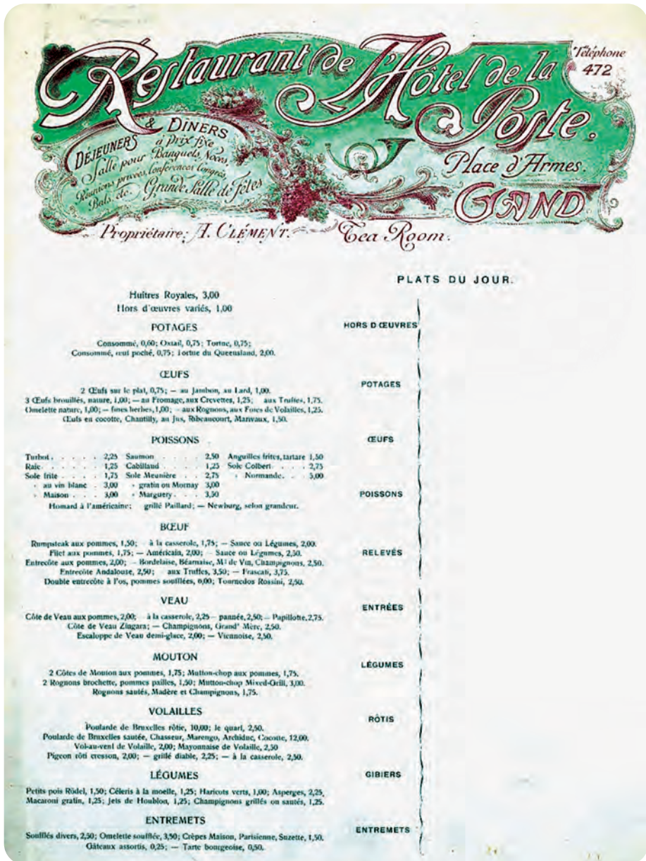
Afb. 6. Menukaart van Le Caveau, ca. 1910. Bron: Universiteit Gent. Fonds Vliegende Bladen.