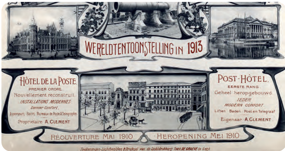
Afb. 3: Affiche (fragment) uitgegeven naar aanleiding van de heropening van het Posthotel in mei 1910. De uitbater Clément trok duidelijk de kaart van Gent als toeristische trekpleister n.a.v. de nakende Wereldtentoonstelling van 1913. De affiche werd uitgegeven in vier talen.

Wanneer precies het idee ontstond om het Posthotel om te vormen tot een luxehotel is niet geheel duidelijk. De plannen van schepen Octave Bruneel (1844-1914), die in 1902 reeds aan de stad had gesuggereerd om het gebouw te kopen, voorzagen dat het hotel kon blijven functioneren en kort na de aankoop van het complex investeerde de stad zelfs in elektrische verlichting. Mogelijks was het idee bij de aankoop zelf al latent aanwezig. Sowieso bleekte de stad van ambitie naar aanleiding van de Wereldtentoonstelling van 1913. Men trok alle registers open.