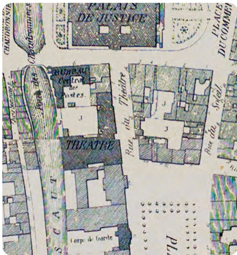
Afb. 2. Situering van het Posthotel tussen de Opera en de feestzaal L'Union aan de Kouter met de toenmalige perceelindeling. Afbeelding bewerkt door de auteur.