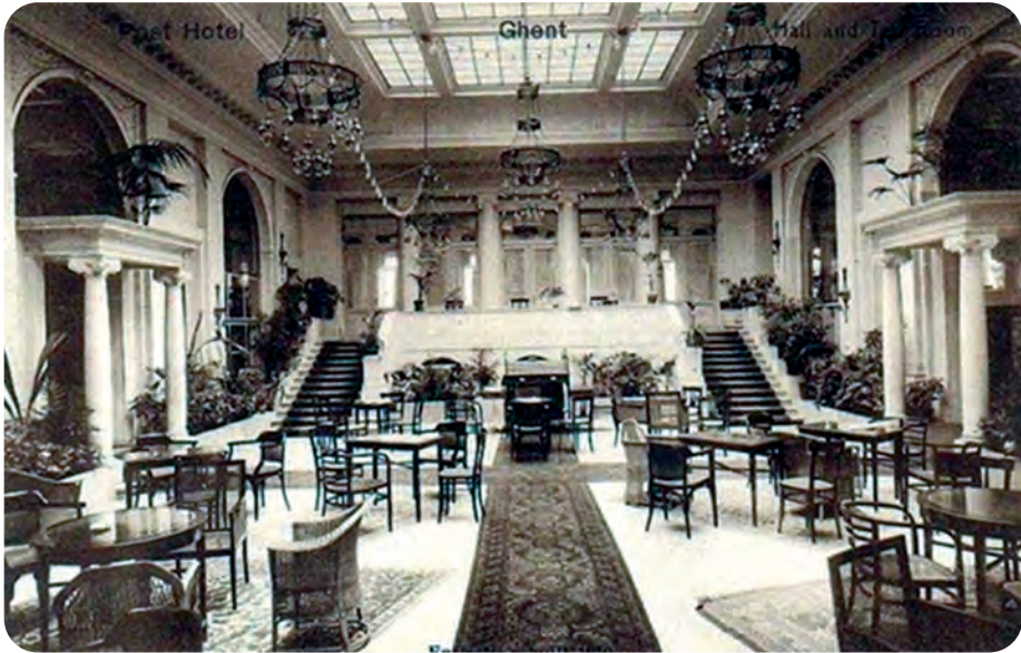
Afb. 5.a. Zicht op de centrale hal met de 'tearoom' van het hotel. Via de dubbele trap op de achtergrond betrad men de feestzaal.