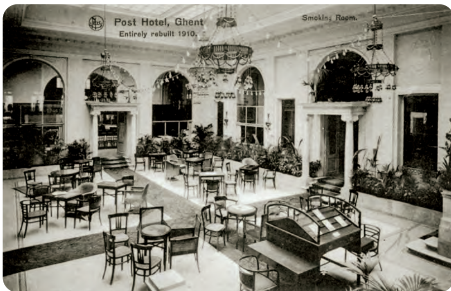
Afb. 5.b. De tearoom in de centrale hal gezien van de andere kant.

Toen de problemen zich begonnen op te stapelen, bleek de liftenfirma moeilijk tot de orde te roepen. Clément ergerde zich in maart 1911 aan het feit dat de lift sedert de installatie nog geen week naar behoren had gewerkt: 'il ne c'est écoulé aucune semaine depuis l'installation sans qu'il y ait eu un accroc dans le fonctionnement.' (16) Het toppunt in de malaise werd bereikt toen de rem van de lift haperde en de cabine tegen het plafond botste. Uit miserie sloot hij een duur onderhoudscontract af met de firma Otis, de opvolger van Mignot. De oplevering van de liften zou pas volgen op het einde van 1911.