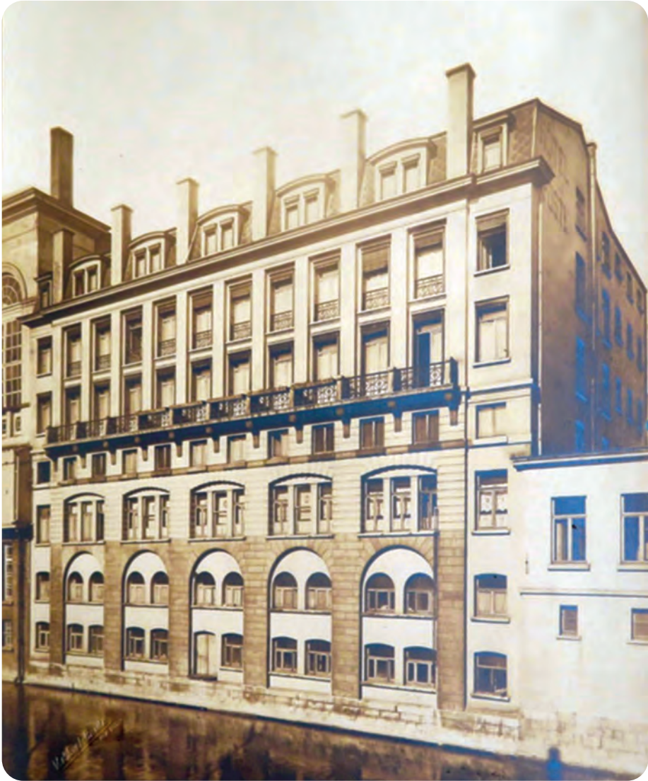
Afb. 8. Achtergevel van het Posthotel, ca. 1925