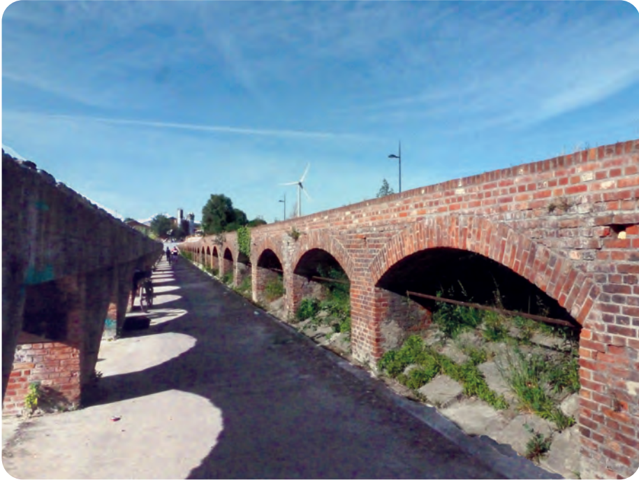
Afb. 8. De dubbele bogenrij in schaduwbeeld goed zichtbaar op de geasfalteerde weg tussen de bogen, waar voordien een treinspoor liep (foto 2020).

Gedeeltelijk daarvan door open ruimte afgescheiden, is er nog meer en hoger opschietend groen. Dat verbergt een speelpleintje met café, met ingang via de Chinastraat, zijstraat van de Koopvaardijlaan. Veel kosten werden daarvoor niet gemaakt. Met wat gestort zand, afvalhout, autobanden en dergelijke, rees de nodige infrastructuur uit de grond. Gemaakt en gerund door jonge enthousiastelingen. Een naam was rap gevonden: Plage Bricolage en Bar Bricolage. Die geven zeer accuraat de werkelijkheid weer, zoals je kan zien op afb. 12. Een jongensdroom, waar de meisjes, de jonge mama's en papa's met hun kinderen zich op zonnige dagen maar al te graag bij aansloten en meehielpen.