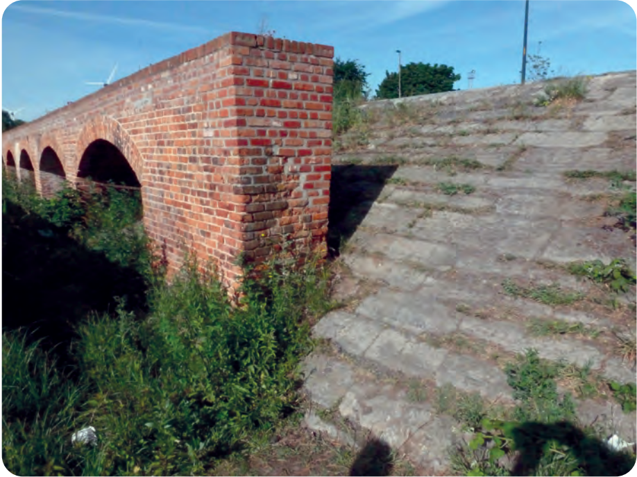
Afb. 7. Hellende, met natuursteen bedekte loskaai en aanzet van een bakstenen bogenrij (foto 2020).

eronder gereden treinwagens konden van bovenaf eveneens geladen worden. Hout wachtend op vervoer werd afgeschermd door hangardaken (nu verdwenen), te zien op de oude foto's, zoals deze in afb. 2.