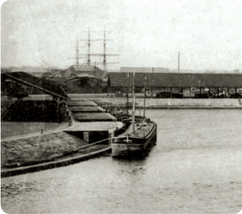
Afb. 9. Dit detail van afb. 3 laat zien hoe hogerliggende binnenscheperen werden geladen vanop de overdekte bogen. Uiterst links een overkapping ter bescherming van het eventueel nog weg te halen hout. In de achtergrond vaag een driemaster.