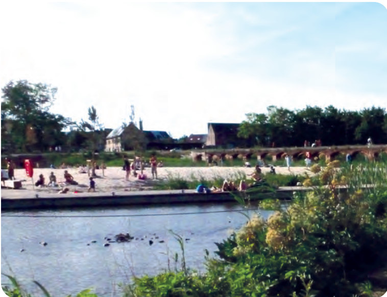
Afb. 10. Het met zand opgevulde Kapitein Zepposstrandje op een zonnige zomerdag in 2020.