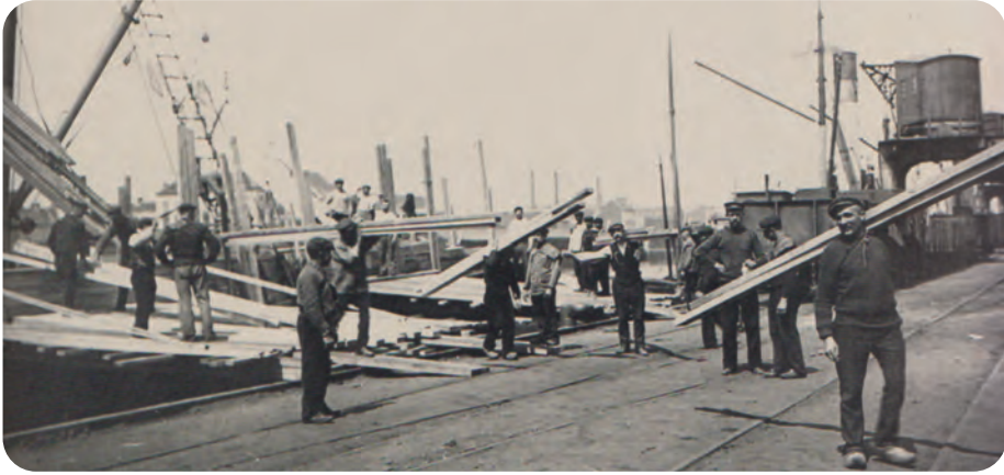
Afb. 6. Het gezaagd hout wordt na het lossen door dokwerkers op de schouder weggedragen en gestapeld op spoorwagons. Let op de kloefen (klompen).