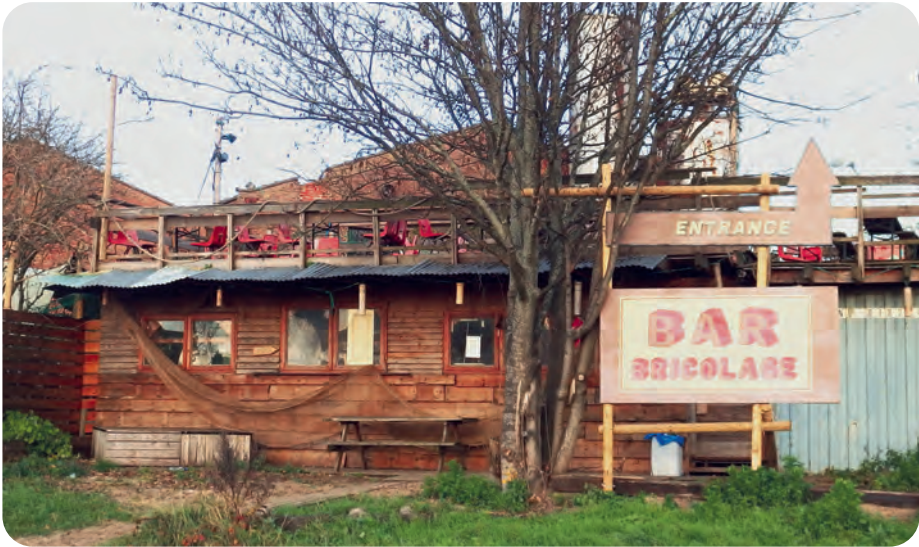
Afb. 12. Nogal ruw, maar comfortabel ook binnenin. In december 2020 echter potdicht.