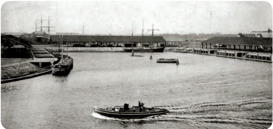
Afb. 3. Gezicht op het Houtdok vanuit de verbinding met de Voorhaven en het Handelsdok (niet weergegeven, onder links en rechts)

Een gedeelte van het rondhout werd bestemd voor het klieven van latten, toen veel gebruikt voor onderdaken, ‘valse’ plafonds en wanden. Die dunne latten werden aangebracht als raamwerk om te bepleisteren. Een lattenklieverijtje op