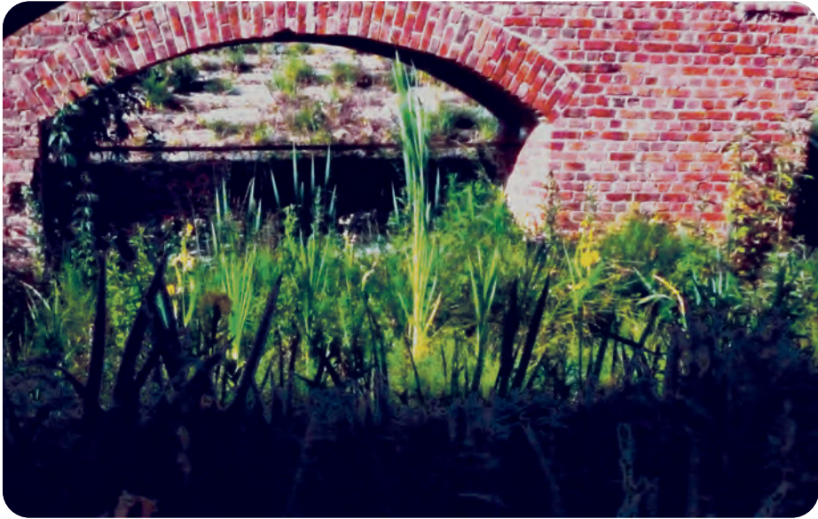
Afb. 11. Oevervegetatie, met o.a. Gele Lis, bij een van de vele bogen rond het Houtdok (foto 2020).

een doorvaarthoogte van 7,8 m. Iets wat blijkbaar maar heel zelden nodig is. Nu is de brug een ideaal startpunt voor een wandeling die naar het Houtdok leidt.