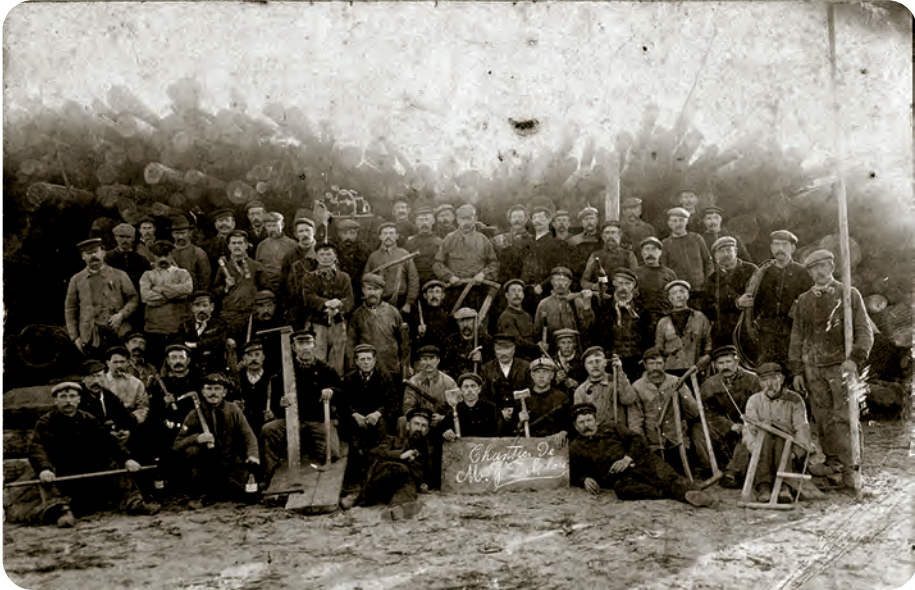
Afb. 5. De lattenklievers van het bedrijf Delalou nemen even de tijd om te poseren met hun 'alaam'. Foto 1908 in familiebezit.

Een buitenbeentje vormden de Papierfabrieken van Langerbrugge, die hout lieten lossen en stockeren in het water van een vroeger deel van de Sassevaart, min of meer parallel aan het Zeekanaal aan de landzijde van de Wiedauwkaai. Enkele decennia geleden schakelde dit Fins geworden bedrijf, onderdeel van Stora Enso, voor zijn productie van (vooral) krantenpapier, succesvol over van ingevoerde boomstammen als grondstof naar de verwerking van plaatselijk afval: oud papier. Twee vliegen in één klap dus: van hinderlijk afval naar iets gloednieuw. Dat dan zelf weer... afval wordt, en opnieuw... Over de voorgeschiedenis van dat bedrijf: zie Heymans (1984).