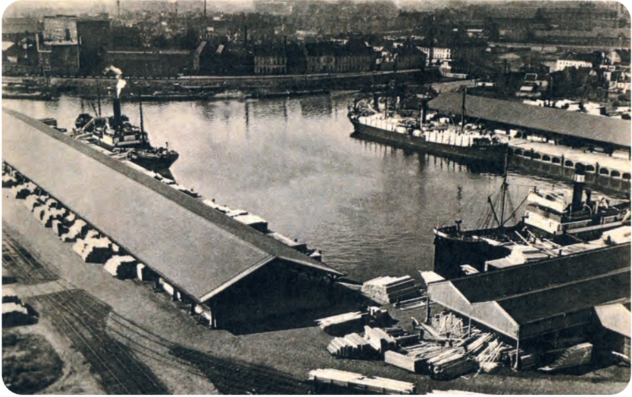
Afb. 2. Overzichtsfoto (ongedateerd, Stadsarchief) van het Houtdok in volle activiteit. Let op de overdekte bogen rechts boven.