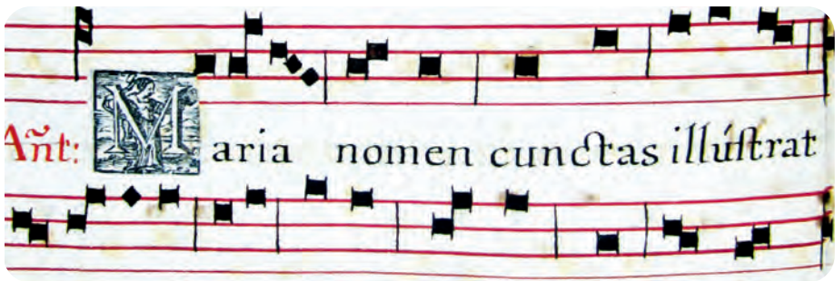
Afb. 3. Detail met een versierde initiaal in hetzelfde antifonarium. Deze werd er vermoedelijk op gestempeld.

Deel 1 bevat minstens 135 drukwerken uit de periode tot 1699. Daarbij is een Antwerpse bijbel uit 1531 het oudste stuk. Verder: een ruim een eeuw jongere, eveneens Antwerpse bijbel (Balthasar Moretus) van 1634 en oude Gentse drukken van Joos Dooms, meerdere werken over de invloedrijke François de Sales, naar wie de salesianen van Don Bosco genoemd werden, en een beschrijving van de mirakelen bekomen door tussenkomst van de relieken in Mechelen bewaard.