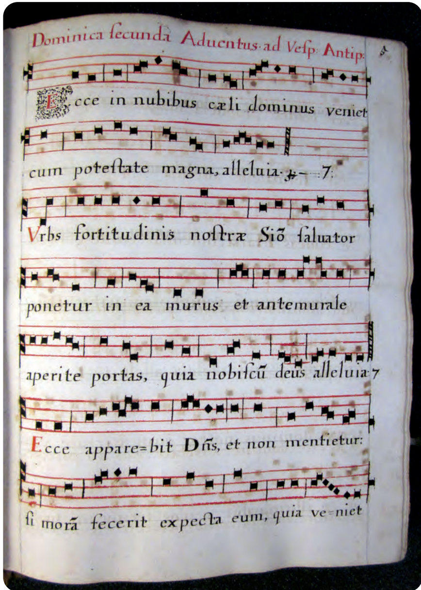
Afb. 2. Bladzijde uit het Gents-Engelse antifonarium in afb. 1. Dergelijke boeken waren in die periode allemaal handwerk.