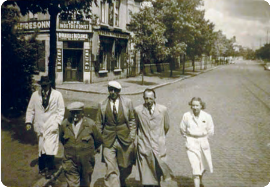
Afb. 4. Vermoedelijk wandelen ze ter hoogte van de Parklaan - Burgravenlaan, maar wat was de 'stiel' van deze lui, vraagt de bezitter van deze foto zich af.

Berichten aan de leden sturen is een dure en weinig snelle aangelegenheid.