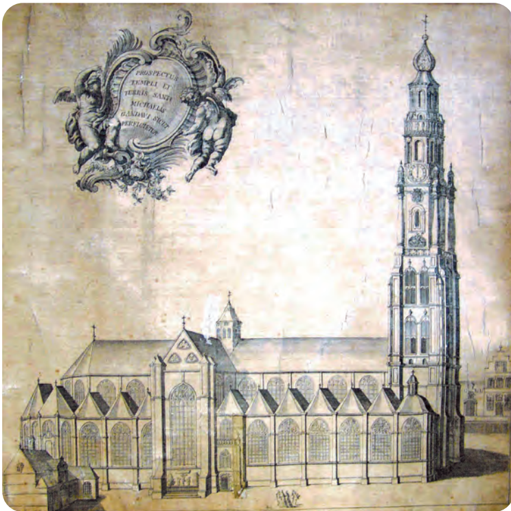
Afb. 2. Gravure door Norbert Heylbrouck (Atlas Goetghebuer L 74 nr. 11) met de toren uitgebeeld aan de hand van de in het STAM bewaard gebleven maquette.

De stijl van Cruyls ontwerp is zuiver laatgotisch. Zonderling is wel dat bij een bijna 10 jaar eerder gemaakte maquette voor dezelfde toren ‘de onbekende ontwerper resoluut koos voor een veel modernere vormtaal’ (citaat uit De Vuyst, 2015). Er kan geen twijfel bestaan over de datering van dit nu in het STAM bewaarde imposante stuk: het draagt een authentiek jaartal 1653. Dit ontwerp viel duidelijk in de smaak. De maquette bleef lange tijd in de kerk zelf bewaard.