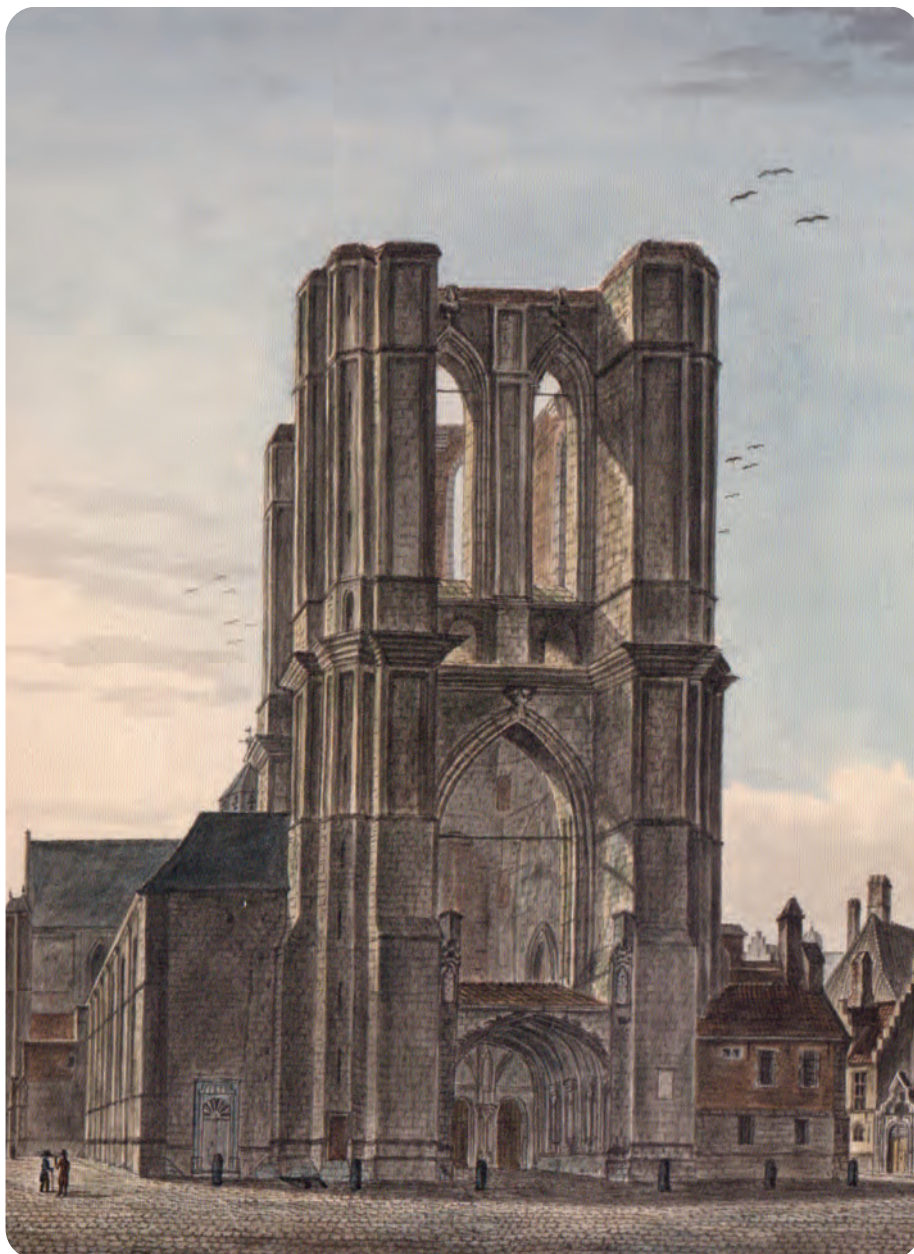
Afb. 7. De bekende Sint-Michiëlstorenstomp zoals gezien door de Brusselaar Wynantz in de Hollandse Tijd, omstreeks 1820 (overgenomen uit Kleurrijk. Wynantz en Gent, Snoeck & Zwarte Doos ). Bemerkt de grote vensteropeningen zonder glas en het primitieve dakje boven de overwelfde buitenste ingangspoort. Het schip van de kerk was toegankelijk voor de gelovigen via twee afsluitbare deuren achterin de open 'torenhal'. Uiterst rechts een stukje van het in een vorig GT-nummer beschreven Hof van Ravenstein.