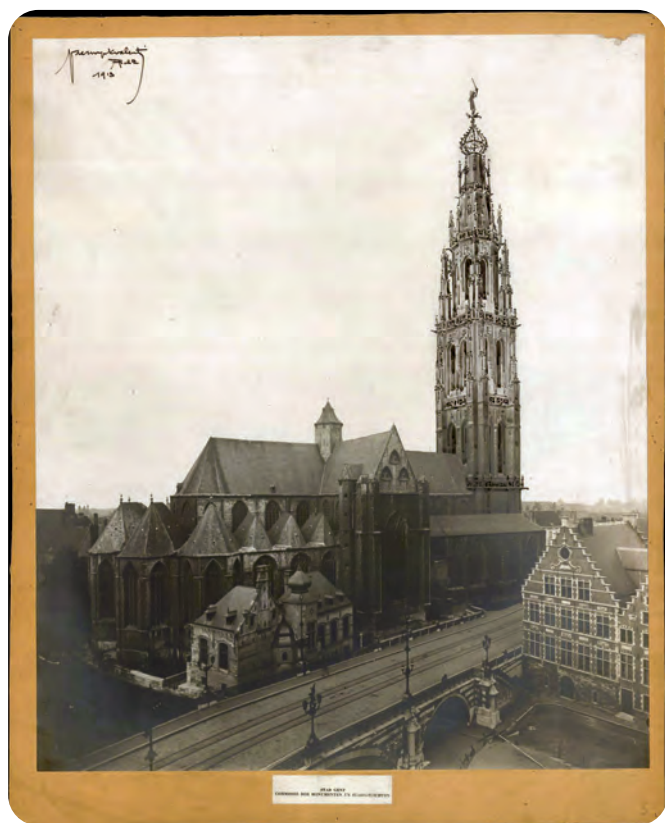
Afb. 6. Fotomontage van Vaerwyck (1913) bekroond met ‘ajuin’ waarop de draken dodende Sint-Michiël te zien is.

Met uitzondering van de 17de- en 18de-eeuwse concepten of preconcepten, waaronder dat van de maquette in STAM dan nog een mengvorm laat zien, vertoonden de ontwerpen allen gotische kenmerken. Die stijl werd slechts aarzelend, schijnbaar met tegenzin verlaten. Dat mogen we besluiten uit de vergelijking van de bewaard gebleven ‘moderne’ maquette uit 1653 en het ontwerp – laatgotisch tot en met – van Lieven Cruyl dat negen jaar later gemaakt werd. Deze eminente graficus, die jarenlang in Italië werkte, kon het trouwens niet laten op zijn groot gezicht op oostelijk Gent nog in 1678 zijn bewondering te uiten voor de voor de gotische architectuur van het Schepenhuis van de Keure in zijn vaderstad (zie GT 2021 nr. 1). Wonderlijk toch hoe dit volmaakt laatgotisch ontwerp van een topbouwkundige te dateren is in 1662, toen deze stijl zo goed als helemaal verlaten was.