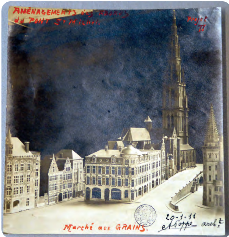
Afb. 5. Impressie door architect Poppe (1911) voor mogelijke bebouwing aan de Sint-Michielshelling met torenspits in laatgotische stijl.

destijds het 'Boerekot'. Voor de Sint-Michielstoren zag deze architect het groots. In 1911 betrok hij ook de Sint-Michielshelling en bijhorende bebouwing in zijn ontwerp, maar kwam niet verder dan de hierbij gereproduceerde voorstelling (afb.5).