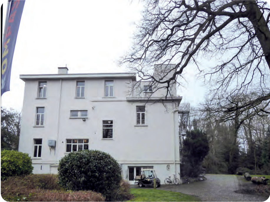
Afb. 5. Het woonhuis ontworpen door arch. Jules Van den Hende.

de vijver (afb. 3) weergegeven en de inplanting van een neerhof (boerderij) met park. Een bijzonder relict is de bewaard gebleven ijskelder (afb. 4). Op het domein werden in maart 1944 vier bunkers opgetrokken met dikke baksteenmuren en een betonnen dak.