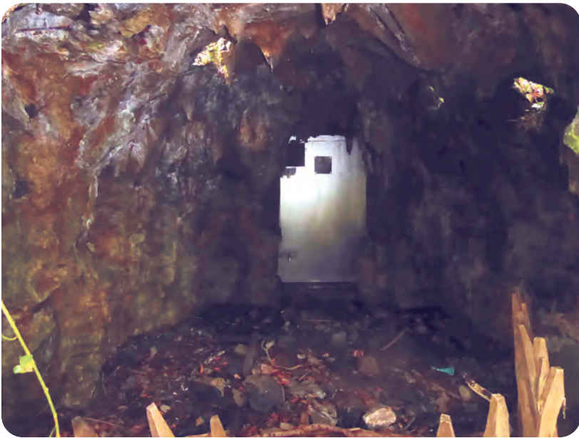
Afb. 4. Ingang van de vroegere ijskelder, nu vleermuizenparadijs (foto B. D'Hondt, 2021).

Zeker niet het minst belangrijke onderdeel van dit domein, en waarschijnlijk het oudste, was een hoeve, vermoedelijk Ex(ter)meere of He(e)gsmeere (Van-averbeke, 1968). In Van Walsites en Speelhoven (Charles e.a., 2008), opge- maakt aan de hand van het grote 'kaartschilderij' van de Vrijheid van Gent door Jacques Horenbault (1619), wordt het goed kort beschreven als 'omwal- de site' en aangeduid met het nummer WSH010.