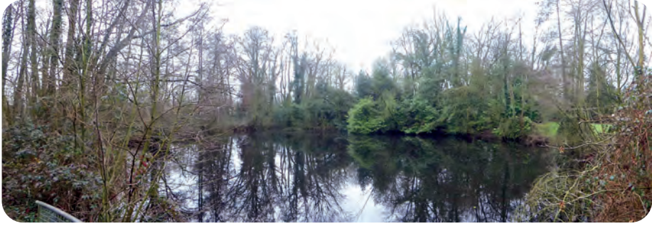
Afb. 3. De vijver... minstens twee eeuwen oud (foto Bart D'Hondt, 2021).

Zeker niet het minst belangrijke onderdeel van dit domein, en waarschijnlijk het oudste, was een hoeve, vermoedelijk Ex(ter)meere of He(e)gsmeere (Van-averbeke, 1968). In Van Walsites en Speelhoven (Charles e.a., 2008), opge- maakt aan de hand van het grote 'kaartschilderij' van de Vrijheid van Gent door Jacques Horenbault (1619), wordt het goed kort beschreven als 'omwal- de site' en aangeduid met het nummer WSH010.