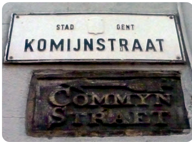
Afb. 1. Een unieke getuige van de eerste reeks straatnaamborden, nog steeds op zijn originele plaats. Bleef vermoedelijk bewaard dank zij overpleistering. Vroegste vermelding van de naam volgens Gysseling: 1361. Naar de bekende specerijplant, zoals ook de Peperstraat waarin dit straatje uitmondt. (foto 2020).

Oostenrijks regiem, werden de in gebruik zijnde straatnamen officieel erkend en vastgelegd. Toen werden deze aan de straathoeken op metalen plaatjes aangebracht (afb. 1). Voor die tijd was dit een hele innovatie en een straffe prestatie.