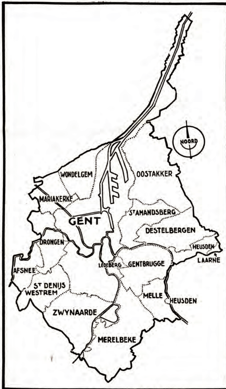
DE OPRICHTING VAN GROOT-GENT. — Bovenstaande kaart toont het plan van Groot-Gent, zooals het bij Besluit verschenen in het Staatsblad van 29 Mei is opgericht. De gemeenten Afsnee, Gentbrugge, Ledeberg, Mariakerke, Merelbeke, Oostakker, Sint-Amandsberg, Sint-Denijs-Westrem, Wondelgem en Zwijnaarde worden volledig ingelijfd, alsmede gedeelten van Destelbergen, Heusden, Laarne, Melle en Drongen. Hiermede telt Groot-Gent circa 254.158 inwoners.