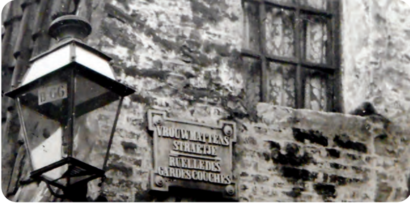
Afb. 2. Een tweetalig straatnaambord als sterk voorbeeld van fantaisistische vertalingen: de matevrouwen werden vroegvrouwen: gardes couches. De huidige naam Jonkvrouw Mattestraat (sinds 1942) is nauwelijks beter: de per definitie zeer arme matevrouwen (matewiven, zie artikel in GT 2019 over het Schokkebroersvestje) promoveerden tot een volslagen gefantaseerde jonkvrouw Matte, wellicht bedoeld als afkorting van een even onbekende Mathilde.

ijver de verfransingspolitiek van onze stad door. De oude Gazette van Gent moest in het Frans verschijnen, met een beknopte Vlaamse vertaling. Aan de rederijkerskamer van de Fonteynisten werd verboden nog langer Vlaamse toneelstukken op te voeren. Nog andere dergelijke maatregelen werden aangewend om het Vlaams uit het openbaar leven te bannen.