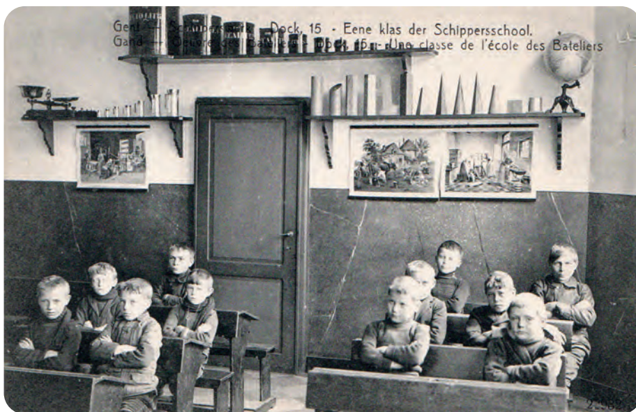
Afb. 8. Een klein klasje schipperskinderen van de Schipperschool, wellicht kort voor de Eerste Wereldoorlog. Bovenaan: de didactische tinnen inhoudsmaten, links naast de deur: de gewichten, rechts: de meetkundige lichamen en een wereldbol, allemaal belangrijke dingen voor toekomstige schippers. Daaronder: uitgerolde kaarten met leerrijke en sprekende afbeeldingen. Hetzelfde klaslokaal was ook in gebruik voor de meisjes. Bemerkt de zeer brave houding van de jongetjes: met de armen gekruist. Zo konden ze geen (of toch minder) kattenkwaad uitsteken!

re school bezoeken lag voor die kinderen niet voor de hand. Ze hadden behoefte aan een school die vlakbij hun schepen gelegen was. Sommige parochiale scholen weigerden schipperskinderen omwille van hun leerachterstand of omdat ze niet een minimaal aantal dagen aanwezig konden zijn. Geweigerde trokken, aldus de katholieken, dan vaak naar een gemeenteschool met veel kinderen van socialistische ouders.