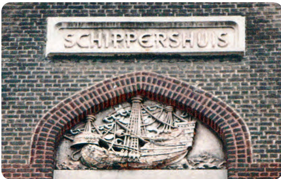
Afb. 4. Gevelsteen van een middeleeuws zeeschip, kopie van het exemplaar in de gevel van het gildehuis van de Vrije Schippers aan de Graslei. Foto genomen na de brand in 1989 (DSMG, Vliegende Bladen Gent, waterlopen – binnenschipperij). De voorstelling in de topgevel van de kapel is lichtjes misleidend de ‘bakken’ en spitsen van de binnenschippers leken helemaal niet op karvelen en dergelijke.

nieuwe Schippershuis in mei zou geopend worden. Op vrijdag 12 mei nam conciërge Collier zijn intrek in het gebouw. Op 14 mei ging de inzegening van het Huis niet door omdat bisschop Stillemans verhinderd was. De volgende dag kon het ook niet geopend worden omdat het schilderwerk nog niet af was. In de gelagkamer werd op de muur geschilderd: ‘God, Koning, Vaderland’ en ‘Vrij Verbruik’, beide leuzen ook in het Frans.