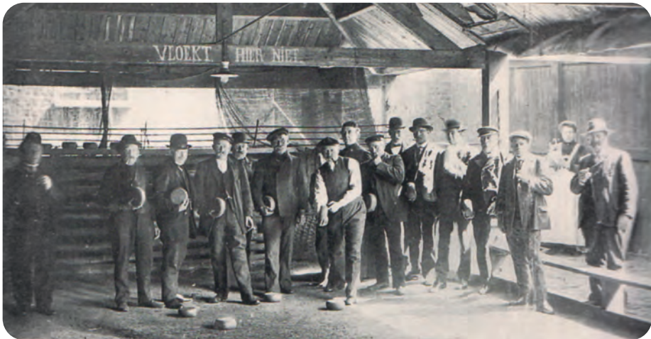
Afb. 1. Het schipperswerk was niet enkel religieus en educatief, het was ook sociaal en recreatief. Zo werd er vanaf het begin voorzien in een overdekte bolbaan voor het bij de schippers zeer geliefde krulbolspel. Om publiek te trekken moest het Schippershuis daarover beschikken. Die werd ingericht achter het Schippershuis. Rechts op de achtergrond, de enige persoon zonder hoofddekse: de schippersaalmoezenier. In plaats van Hier vloekt men niet, staat er dwingend: Vloekt hier niet.

Natuurlijk was er ook een kapel met een honderdtal plaatsen nodig voor een mis met aangepaste preek, voorbereiding op eerste communie, enz. Het was hierbij zeker niet de bedoeling een kapel op te zetten die zou concurreren met de bestaande parochiekerken. Anders dan gewone parochianen, toen sterk gebonden aan hun eigen parochiekerk, konden de schippers altijd al de mis bijwonen in de kerk die het dichtst bij hun aangemeerd schip gelegen was.