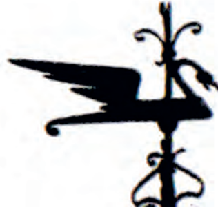
Afb. 6. Helemaal in de top: geen windhaan, maar een windzwaan...

Ondertussen waren enkele knopen doorgehakt. Andere problemen bleven onopgelost. Het Huis zou niet functioneren onder de koepel van het Vincen-tiusgenootschap, maar de ijveraarsters werden wel nauw bij de werking betrokken. Het Schippershuis zou openstaan voor iedereen, dus ook voor toeval-lige passanten in de Gentse haven. De naam van het Huis in drie talen in car-touches aan de voorgevel was dus een duidelijk statement. De klemtoon zou vooral liggen op de religieuze, morele en sociale actie. De werkingskosten zouden gedekt worden door de giften van goeude weldoeners, de opbrengst van omhalingen door vrijwilligers, de verkoop van postkaarten en de verkoop van (geen sterke!) dranken. Hoewel ongeveer iedereen overtuigd was van de noodzaak van een eigen kapel, ook de bisschop, werd de bouw ervan uit-gesteld wegens geldgebrek. Voorlopig kreeg het Huis ook geen gratis school, omdat een mogelijk lokaal hiervoor veel te klein was en niet geschikt voor onderwijs.