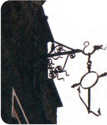
Afb. 5. Ankertje gedragen door een mini zeemonstertje als uithangteken. Voor wie het niet zou doorhebben, waren er gevelschriften in drie talen: Schippershuis, Maison des Bateliers en Sailors House.

waarin erop werd gewezen dat een totaal nieuw project niet zonder enige kinderziekten van start kon gaan.