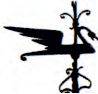
Afb. 6. Helemaal in de top: geen windhaan, maar een windzwaan...

Ondertussen waren enkele knopen doorgehakt. Andere problemen bleven onopgelost. Het Huis zou niet functioneren onder de koepel van het Vincen-tiusgenootschap, maar de ijveraarsters werden wel nauw bij de werking betrokken. Het Schippershuis zou openstaan voor iedereen, dus ook voor toeval-lige passanten in de Gentse haven. De naam van het Huis in drie talen in car-touches aan de voorgevel was dus een duidelijk statement. De klemtoon zou vooral liggen op de religieuze, morele en sociale actie. De werkingskosten zouden gedekt worden door de giften van goeude weldoeners, de opbrengst van omhalingen door vrijwilligers, de verkoop van postkaarten en de verkoop van (geen sterke!) dranken. Hoewel ongeveer iedereen overtuigd was van de noodzaak van een eigen kapel, ook de bisschop, werd de bouw ervan uit-gesteld wegens geldgebrek. Voorlopig kreeg het Huis ook geen gratis school, omdat een mogelijk lokaal hiervoor veel te klein was en niet geschikt voor on-derwijs.