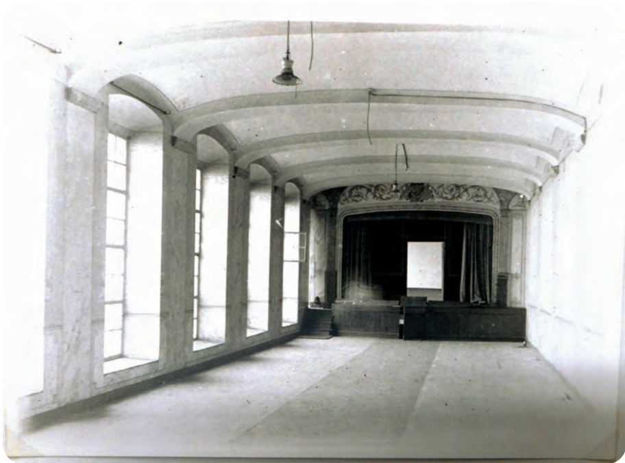
Afb. 7. De leeggemaakte theaterzaal, net voor de afbraak in 1935-1936.