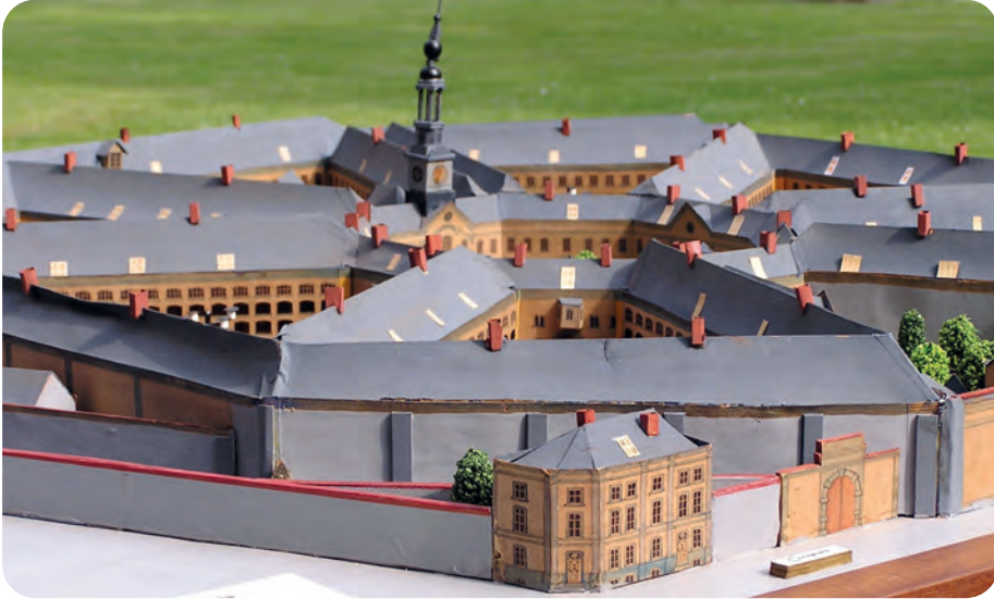
Afb. 6. Het Gevangenismuseum van Merksplas stelt een unieke maquette van het Rasphuis tentoon. (foto Karel Govaerts; 2020).