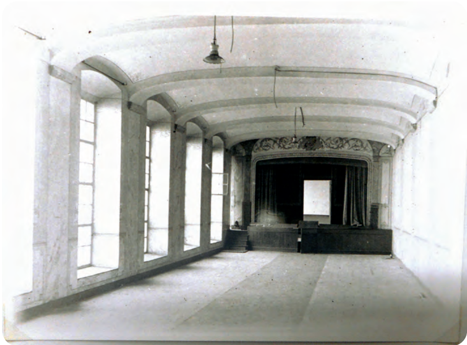
Afb. 7. De leeggemaakte theaterzaal, net voor de afbraak in 1935-1936.