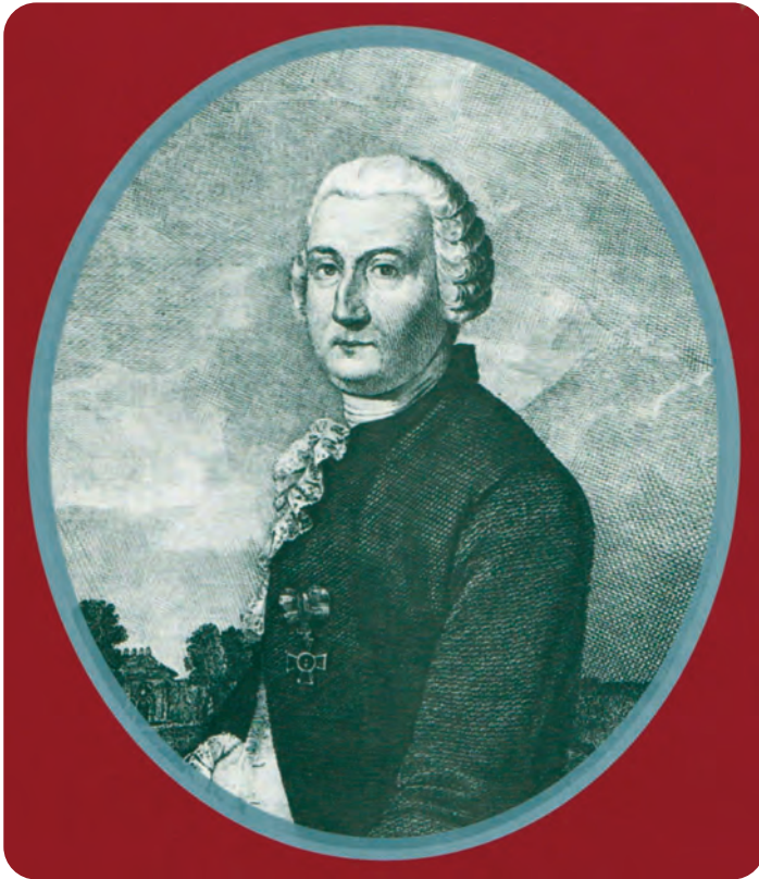
Afb. 1. Vilain XIII. Overgenomen uit de tweede uitgave van zijn boek 'Mémoire sur les moyens ...', 1841, gereproduceerd in Lenders, 1995.

(vergunning) aan het besluit van de Staten waardoor de realisatie kon beginnen.