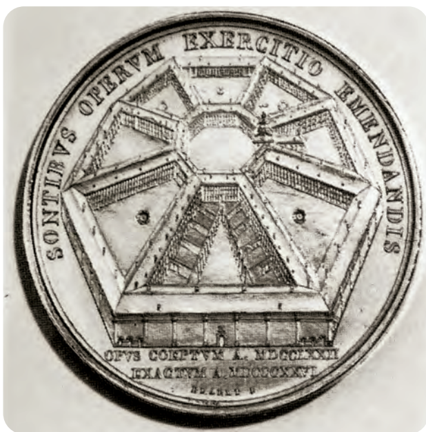
Afb. 5. Voorzijde van een medaille (verguld zilver, 35mm) uitgegeven bij de voltooiing in 1826. Het Latijnse randschrift betekent zoveel als 'werkhuis ter verbetering van veroordeelden'. Onderaan de twee bouwjaren 1772 en 1826. In de rand de naam van de medaillist F. Braemt die dit fijne werkstukje realiseerde (gereproduceerd uit Claeys, P. Médailles gantoises modernes , p. 112, fotoafdruk verz. M. Vollaert).

Toch was er verbetering op komst. Het Hollands tijdperk bracht een positieve kentering in de kwalijke toestanden. Meer zelfs: bij K.B. van 2 september 1824 besliste Willem I tot voltooiing van wat al een halve eeuw gepland was: het bouwen van de al lang geplande tweede helft van de gevangenis. Louis Roelandt, goed gekend van het latere Operagebouw en het Justitiepaleis, werd aangesteld tot architect en het geheel werd begroot op 500.000 gulden. In 1826 was het gebouw voltooid (afb. 5 en 6). De naam werd gewijzigd in 'Huis van Réclusie (opsluiting) en Tuchtiging'. Zwervers werden verwezen naar de nieuw opgerichte 'landlopers kolonie' in Merksplas. Vanaf 1828 werden enkel de veroordeelden tot een criminele straf opgesloten in de instelling aan de Coupure.