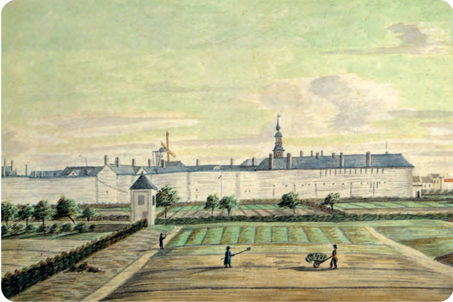
Afb. 2. Het Rasphuis in 1825 (J. Wynantz) gezien vanuit de Nieuwe Wandeling met een nog zeer landelijke deel van Ekkerghem. Binnenin het torentje van de kapel. Achterin de windmolen van de Galgenberg (Archief Gent, Zwarte Doos).

In mei 1773 reeds kon een eerste groep gevangenen het Geraard de Duivelsteen verlaten en zijn intrek nemen aan de Coupure. Enkel personen van acht tot 60 jaar werden toegelaten omdat men enkel werkbekwame gevangenen wenste. Overdag waren de gedetineerden samen in gemeenschappelijke lokalen. 's Nachts (20.30- 05.30 u.) sliep de gevangene alleen in zijn cel. Bij de eerste 'lichting' waren er 280 mannen en 170 vrouwen.