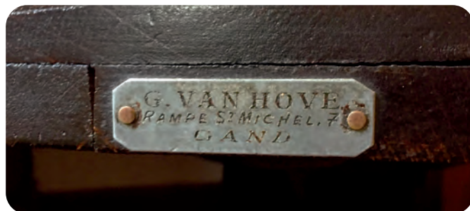
Afb. 4. Naamplaatje van te identificeren meubelmaker.