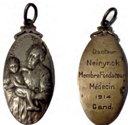
Afb. 1. La goutte de lait 1914

Het is spijtig dat in G.T. zo weinig een beroep gedaan wordt op medailleverzamelaars, want veel artikels kunnen met medailles geïllustreerd worden.