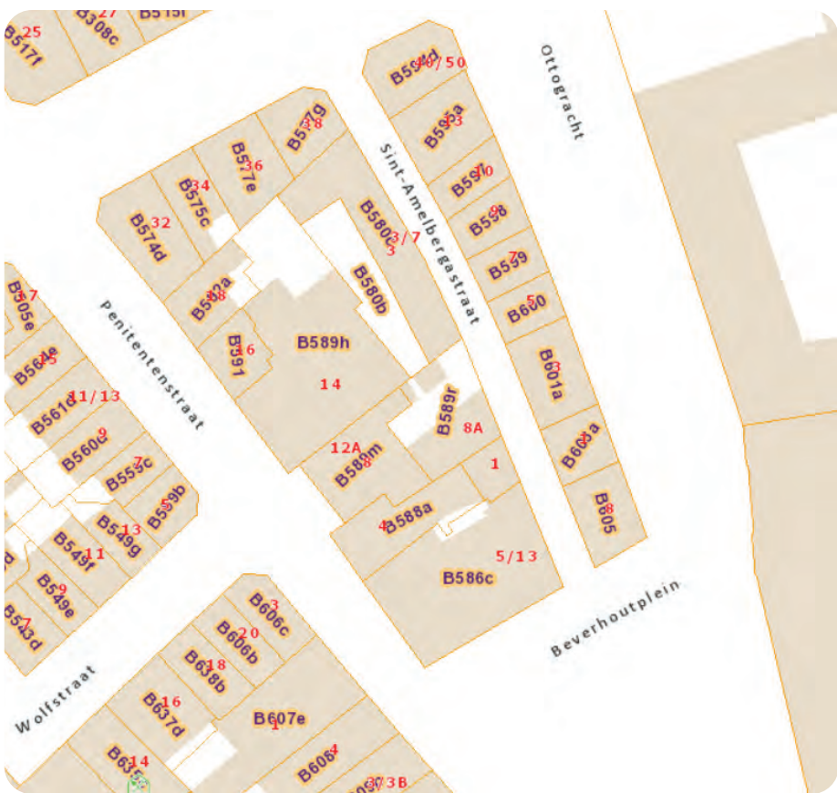
Afb. 4. Actuele kadastrale indeling van de Sint-Amelbergastraat (FOD Financiën – Patrimoniumdocumentatie). Het geboortehuis(je) van Anseele nam een gedeelte in van perceel B 601a.

De huizen aan de noordkant (pare huisnummers) van de toenmalige Lange Penitentenstraat lagen tot 1872 tegen de waterloop Ottogracht, die pas dat jaar gedempt werd (afb. 3). Het werkelijk geboortehuis bevond zich in die ondiepe huizenblok. Na het dempen van de Ottogracht werd de gelijknamige straat breder en werden de achtergevels van de huisjes in de Lange Penitentenstraat straatgevels in de Ottogracht. In de loop der jaren werden die huizen verbouwd of vervangen en kregen de panden een huisnummer aan de Ottogracht (de huidige nummers 1 tot en met 13), wat niet belet dat elk van de huidige panden in de Ottogracht één blok vormt tot aan de Sint-Amelbergastraat en meestal ook daar een huisnummer heeft (de huidige nummers 2 tot en met 12). Om het nog verwarrender te maken: tussen de Sint-Amelbergastraat 8 en