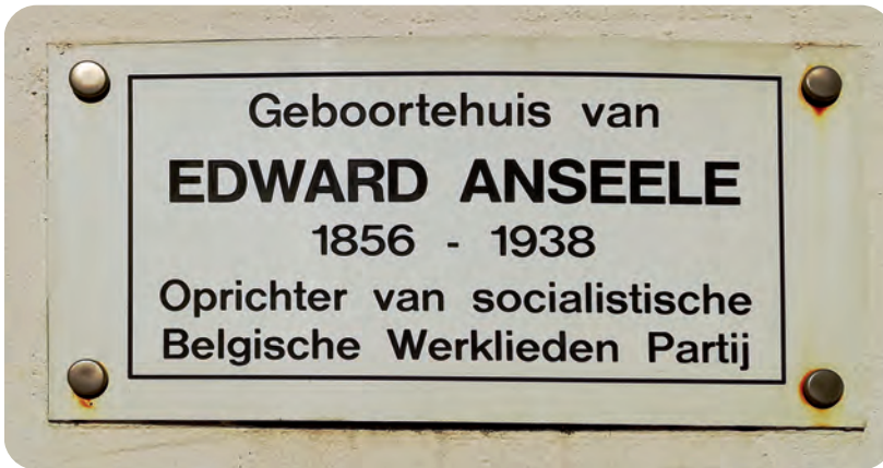
Afb. 1. Herdenkingsplaatje op het verkeerde huis in de verkeerde straat.

Aan de gevel van de woning Penitentenstraat 6-12a hangt een bord met de vermelding dat dit het geboortehuis van Edward Anseele (1856-1938) zou zijn (afb. 1). Goed geprobeerd, maar duidelijk fout. Reeds in 1995 wees Deseyn uiterst beknopt op de fout in een algemeen artikel over Anseele, maar blijkbaar heeft dit niet gebaat. In deze bijdrage wordt in detail beschreven dat het huis onderdeel was van wat nu een gebouw is tussen de Sint-Amelbergastraat en de Ottogracht.