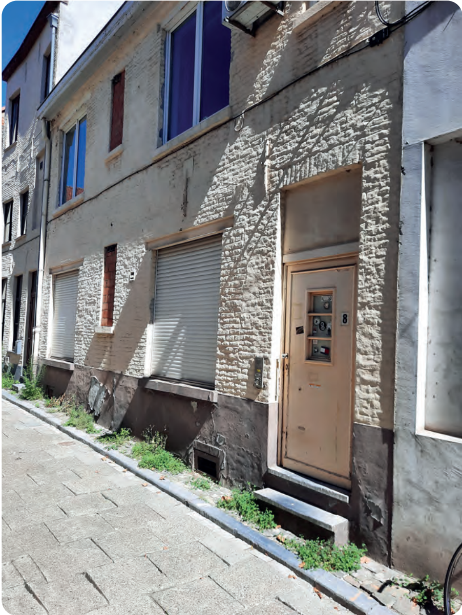
Afb. 5. Huis Sint-Amelbergastraat 8 in 2020.

10 is er een pand genummerd 8/101. Dat de huizenblok zeer ondiep is verklaart dat de huizen slechts één kamer hebben tussen de Sint-Amelbergastraat en Ottogracht. Dit valt zeer duidelijk op in het huis Ottogracht 5/Sint-Amelbergastraat 8/101 waar men vanuit de ene straat door het gelijkvloers raam gewoon de andere straat ziet.