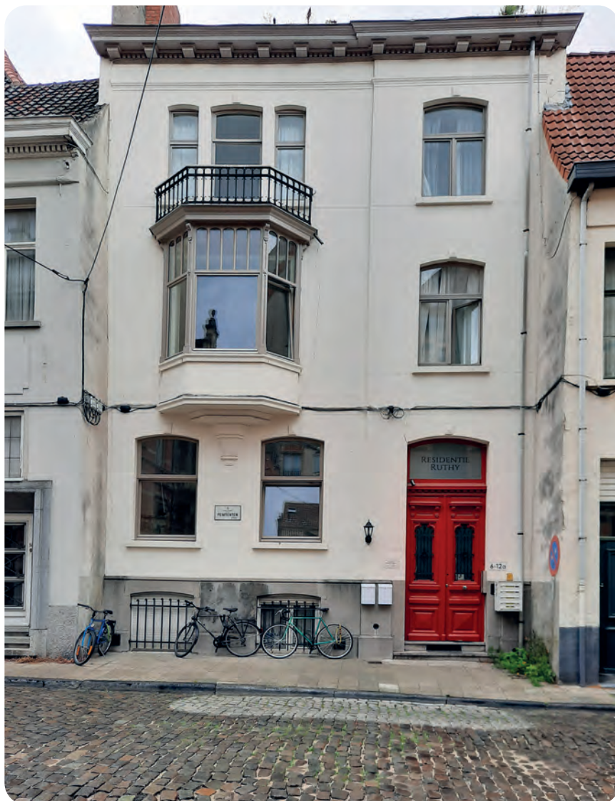
Afb. 2. Huis Penitentenstraat 6-12a in 2020 waar het gedenkplaatje nu te zien is tussen de onderste vensters.

Volgende vragen rijzen op: Is Anseele wel thuis geboren? Zo ja, waar was dit? Bestaat het geboortehuis nog?