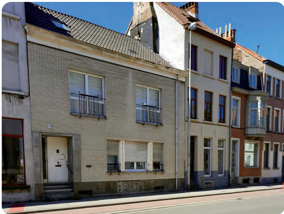
Afb. 6. Het huis van twee bouwlagen met witte gevelsteen en adres Ottogracht 3 vormt de andere zijde van het huis op afb. 5.