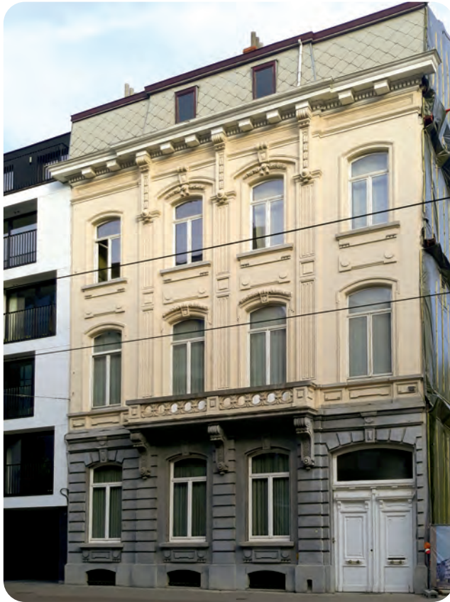
Afb. 4. Woonhuis van Hofman aan de Kortrijksesteenweg, door hemzelf ontworpen (Foto van de auteur).

De nieuwe straten werden volledig bebouwd met typisch 19de-eeuwse neo-classicistische architectuur. Ook Hofman trok er in 1876 zijn eigen woning op langs de Kortrijksesteenweg, met een tuin – eigenlijk een deel van het gewezen park uit 1872 – die doorliep tot aan de Leopold II-laan. Van daaruit kon hij de omvangrijke werken in de buurt van de citadel immers beter coördineren. Het statige herenhuis is nog steeds vrij goed bewaard (afb. 4).