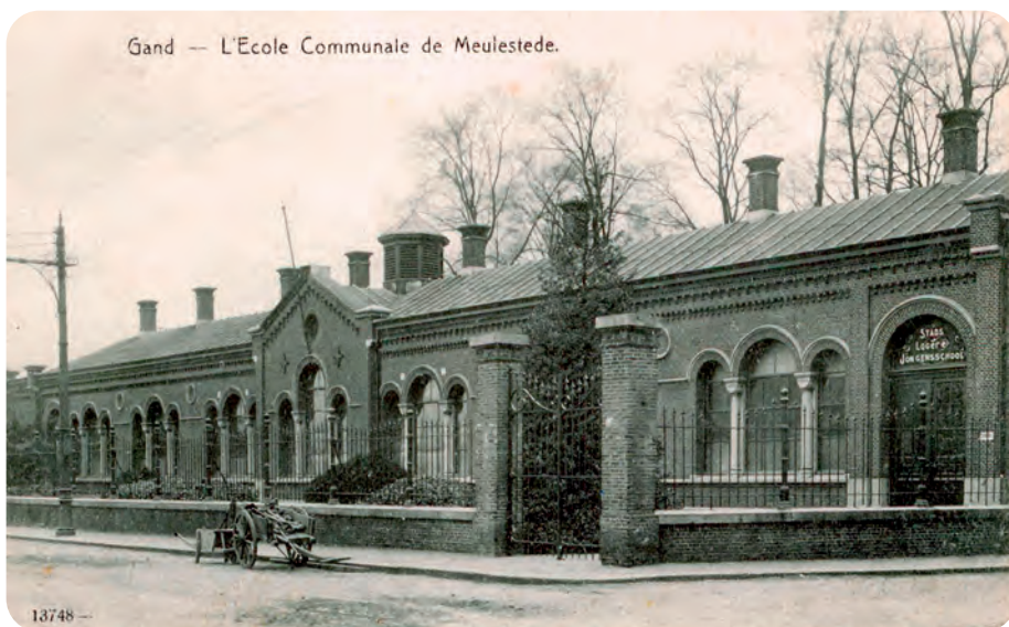
Afb. 2. Jongensafdeling van de vroegere bebouwing van de Carpentierschool aan de meulesteedsesteenweg

Een van de meest tastbare overblijfselen van Hofmans oeuvre is de gewezen meisjesschool in de Academiestraat in neoromaanse stijl. Deze stijl werd door Pauli geïntroduceerd in het Gentse straatbeeld en het gebouw vertoont dan ook veel gelijkenissen met de Nijverheidsschool die een tiental jaar voordien naar zijn ontwerp en onder zijn leiding werd gebouwd. Dat ontging ook de tijdgenoten niet: 'Wat den stijl betreft, het ontworpen gesticht zal in die romaansche bouworde opgevat zijn, waarvan de school op de Lindelei een zoo