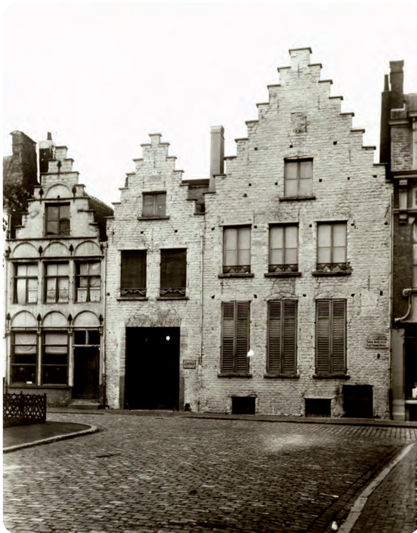
Afb. 6. Pand aan het Edward Anseelepein (toen Garenmarkt) waar de verhandel van Hofman gevestigd was. Wie goed kijkt ziet zijn naambordje rechts van de poort.

Over de modernisering van het beerruimen gepromoot door Hofman, vind je meer in Jaarboek 2020 Van Mensen en Dingen . Over het ontslag wordt in meer detail gehandeld in volgend GT nummer