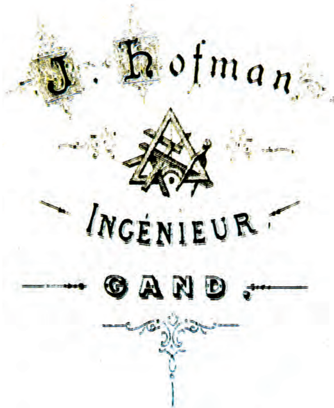
Afb. 1. Briefhoofd van Hofman. (Liberaal Archief, Archief van het Van Crombrugge's Genootschap).

tot burgerlijk ingenieur aan de 'École du Génie Civil' verbonden aan de Gentse Universiteit (afb. 1). Hij studeerde af in 1862.