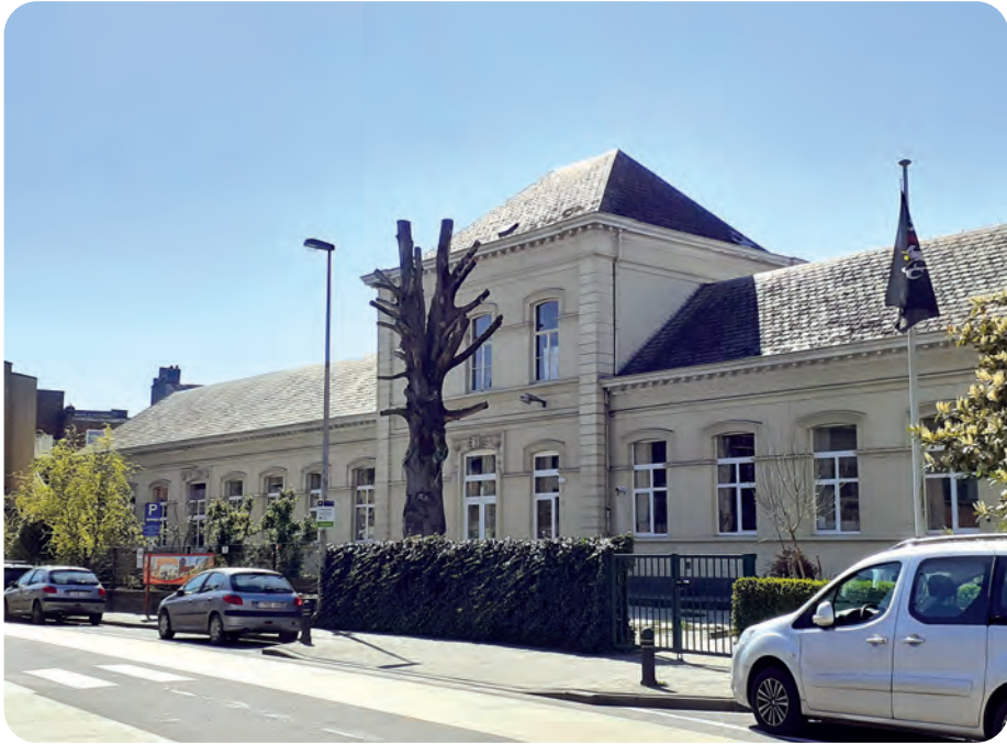
Afb. 3. Stadsschool De Spiegel. (Foto van de auteur, 2020).