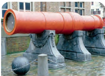
De Dulle Griet Marc Beyaert of het Groot Kanon te Gent Casus van de vijftiende-eeuwse krijgskunst en technologie

De vijftiende-eeuwse Dulle Griet/Groot Kanon-bombarde werd, met medewerking van binnen- en buitenlandse specialisten en met de steun van de Stad Gent, vanaf 1998 gerestaureerd. Door het uitpluizen van archieven en door het technisch onderzoek op de vuurmond zelf, kon de hele historische en militair-technische context van dit unieke wapen opnieuw samengesteld worden. Maar met de voorbije restauratie en dit studiewerk is de kous niet af: dit alombekende Gentse stadsgezicht moet blijvend beschermd worden tegen de tand des tijds en tegen het nooit aflatende vandalisme.