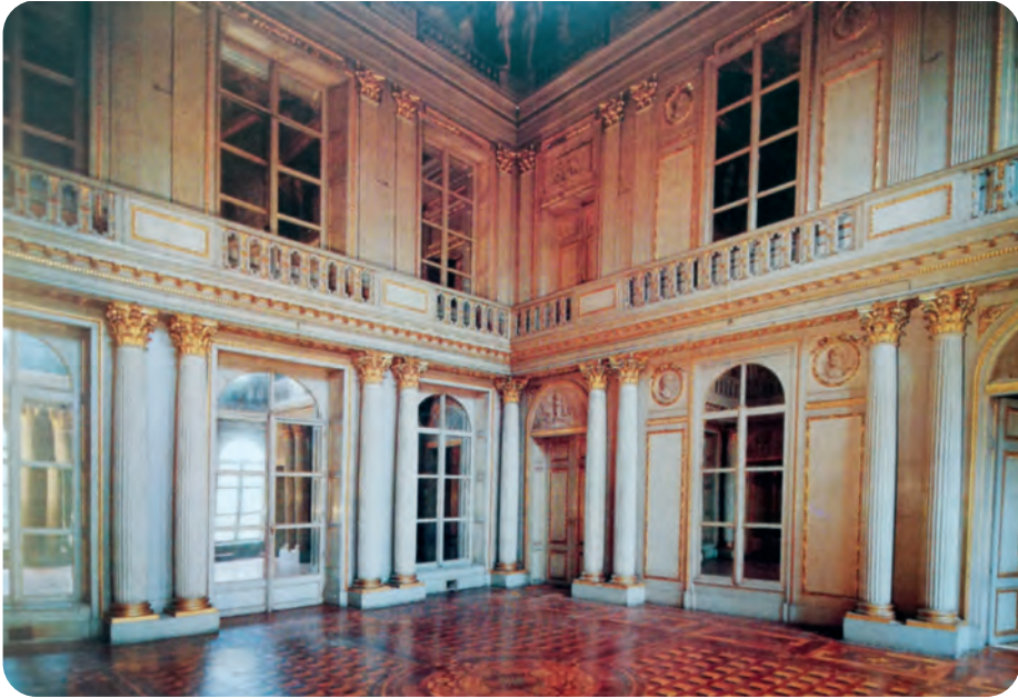
Afb. 4. De grote centrale zaal in het Hotel d'Hane, Veldstraat.

len te lezen, deze microscopische avonturen. Over deze heel aparte kunst van de micrografie: zie beschrijving hierna.