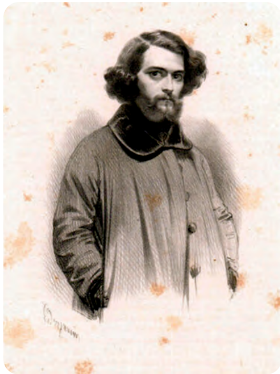
Afb. 1. Portret van Felix Pyat (internet).

Félix Pyat (1810-1889, afb. 1), Frans journalist, toneelacteur en politiek activist, hevig tegenstander van koningschap en keizerrijk, zeker van de latere Napoleon III, tot twee keer toe verbannen uit zijn land, brengt in onderstaand vertaald artikel uit het begin van zijn carrière (1836) een beschrijving van vooral de Gentse kunstverzamelingen in privébezit. De lofbetuigingen aan Gent en ons landje laten we ons - uiteraard - welgevalen. Idem de verandering van nationaliteit bij Rembrandt. De overdreven lofuitingen en de gezwollen taal nemen we op de koop toe.